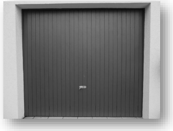
Das ist (k)ein Garagentor

Zum Anfang eine Bitte: Schauen Sie auf das Bild rechts und sagen Sie, was Sie sehen. Die meisten Menschen werden sagen: Ein Garagentor. Die Aussage ist naheliegend, aber falsch. Denn Sie sehen nicht wirklich ein Garagentor. Was Sie sehen, ist lediglich die Abbildung eines Garagentores. Es ist eine zweidimensionale, auf Papier gebannte Repräsentation eines dreidimensionalen Objektes. Das mag sich banal anhören, hat aber eine bedeutsame Auswirkung auf das Verständnis von Realität. Wie zentral die Unterscheidungen von realem Etwas und dessen Repräsentation ist, hat Alfred Korzybskis (1994, S. XVII) mit einem geflügelten Wort auf den Punkt gebracht: „ The Map is not the territory “. Visuelle Repräsentationen sind Abbildungen vereinfachter Wirklichkeit. Mehr nicht.