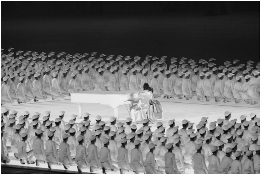
Abb. 5: Lang Lang spielt die Uraufführung von Starry Sky auf der Eröffnungsfeier der Olympischen Spiele Peking 2008 25

aufgeführt worden war: das sogenannte Yellow-River-Konzert , vielleicht die berühmteste chinesische Konzertkomposition überhaupt. Sie entstand 1938 als achteilige Kantate von Xian Xinghai (1905–1945), der 1930–1935 bei Vincent D’Indy und Paul Dukas am Pariser Conservatoire studiert hatte, ab 1940 in Moskau wirkte und hauptsächlich mit Massenliedern, Kantaten und Programmsymphonien hervortrat.