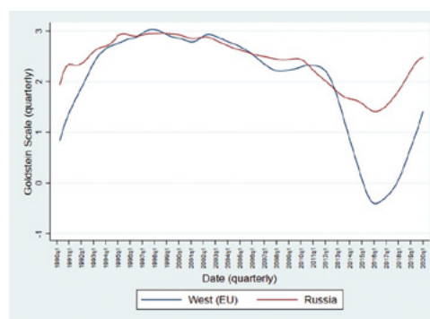
Abb. 2: Aktionen Russland gegenüber EU und EU gegenüber Russland

Ob die Gelegenheit, die sich mit der Trennung und dem sinkenden Spannungsniveau ergibt, genutzt wird, ist allerdings ungewiss. Zwar melden sich im Westen neben den eingangs erwähnten Befürwortern eines Neustarts in Europa auch in den USA die Kritiker der Konfrontationspolitik verstärkt zu Wort (Graham 2019). Und in Russland halten Vertreterinnen der Think Tanks ausgehend vom erreichten Niveau der Dissoziation eine Stabilisierung der Beziehungen für möglich. So signalisiere die Rede über die „Neue Normalität“ (Timofeev 2016: 22), dass die politische Lage berechenbarer und eine Kodifizierung des Status quo in Europa für möglich erachtet wird (Ryzhkov 2019a). Ob sich die