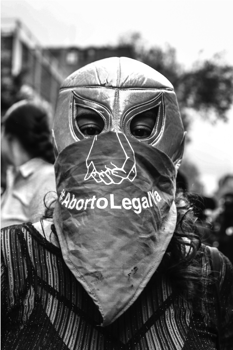
Abb. 9: „Legale Abtreibung, Jetzt“, Demonstration für die mexikoweite Legalisierung von Abtreibung, Zentrum Mexiko-Stadt, September 2019