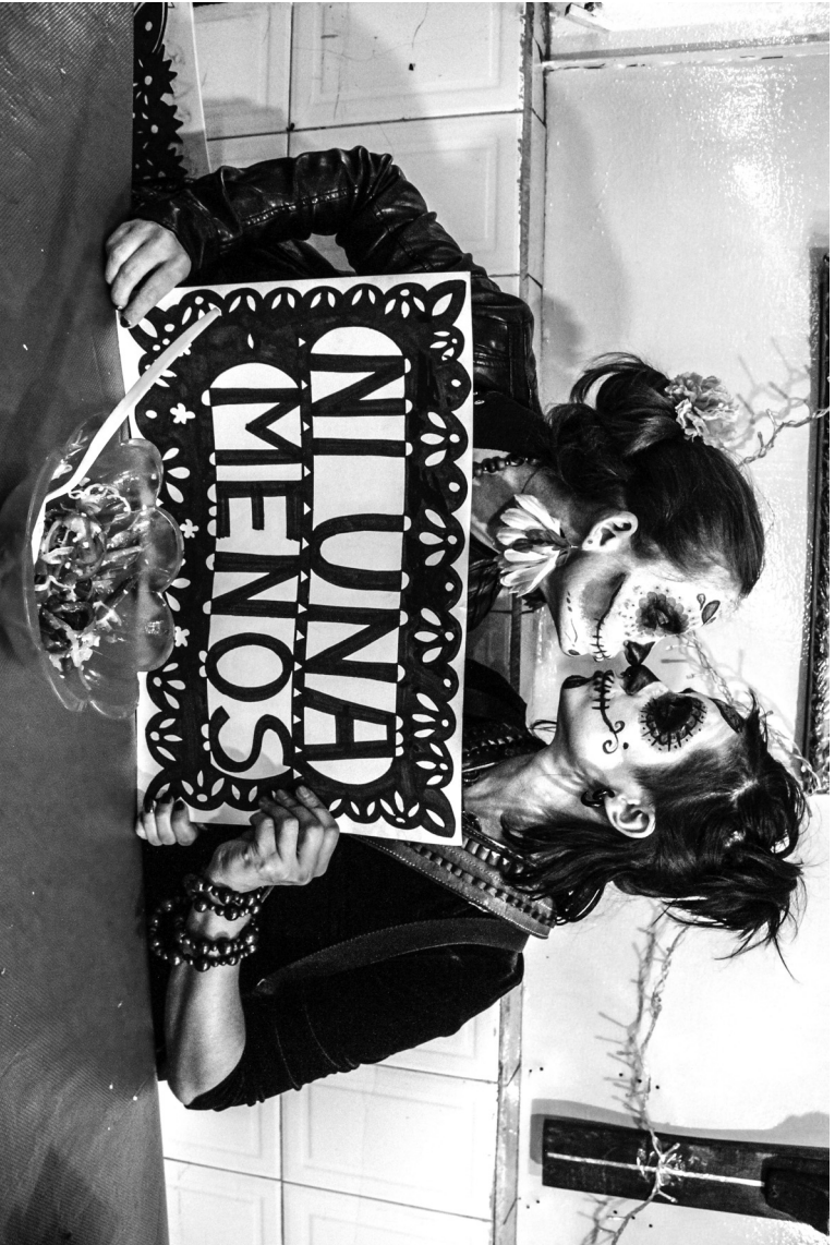
Abb. 2: „Nicht eine weniger“, Foto-Aktion am Tag der Toten, Mercado de Jamaica (Hibiskus/Jamaika-Markt), Mexiko-Stadt, November 2017