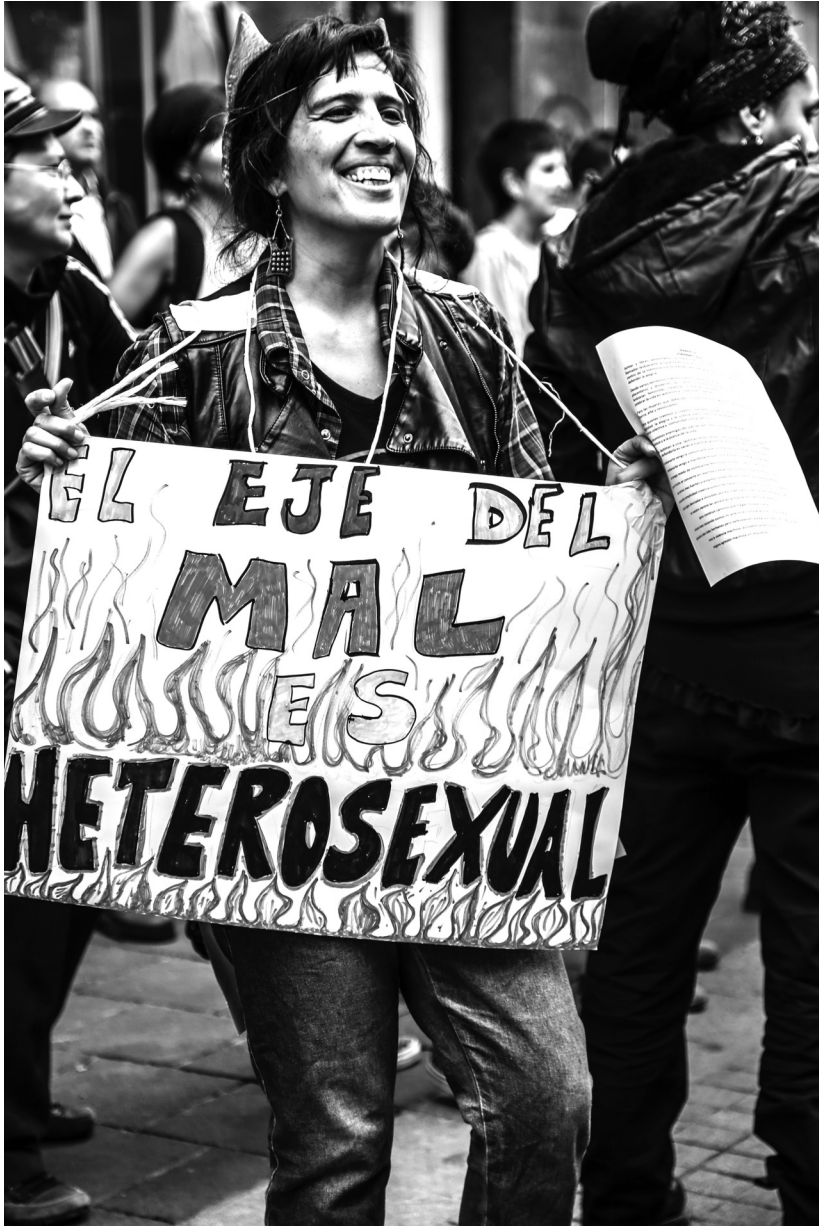
Abb. 10: Die Achse des Bösen ist heterosexuell, Aktion im Rahmen des Festivals LesbianARTE (Lesbische Kunst), Zentrum Mexiko-Stadt, April 2014