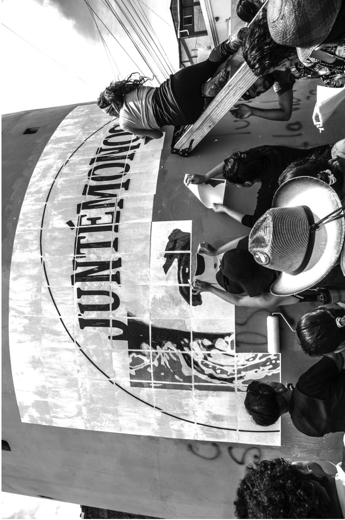
Abb. 3: Paste-up -Aktion nach einem Workshop mit Mitgliedern der Organisation COPINH ( Consejo Cívico de Organizaciones Populares e Indígenas de Honduras – Rat der indigenen und Volksorganisationen von Honduras), dem die ermordete Aktivistin Berta Cáceres angehörte, La Esperanza, Honduras, September 2019