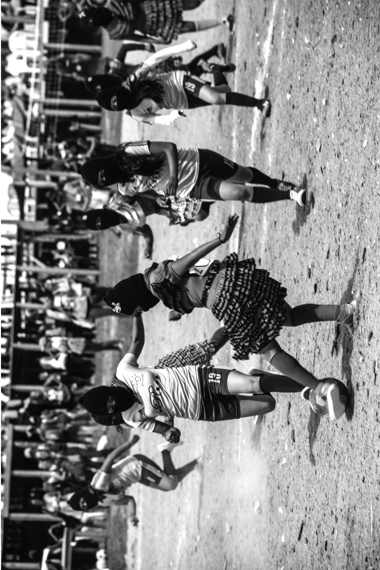
Abb. 1: Treffen der kämpfenden Frauen, Morelia, zapatistisches Caracol (Verwaltungs- und Regierungszentrum), Chiapas, Mexiko, März 2018