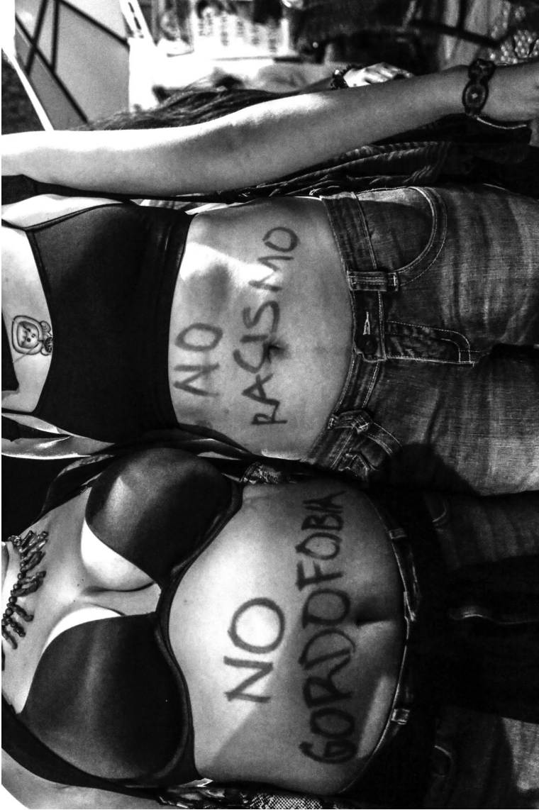
Abb. 5: Nein zu Fatphobie (Feindlichkeit gegen dicke Menschen) und Rassismus, Abschlussdemonstration nach dem 1. antirassistisch-lesbisch-feministischen Treffen, Chiapas, Mexiko, 2014