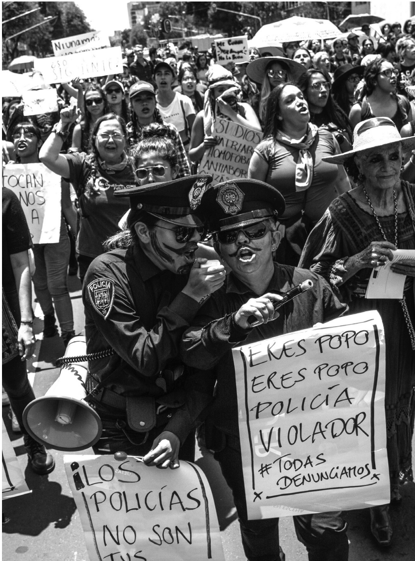
Abb. 8: „Polizist, du bist Scheiße, du Vergewaltiger“, Protestmarsch nach mehreren Vergewaltigungsfällen durch Polizisten, Mexiko-Stadt, August 2019