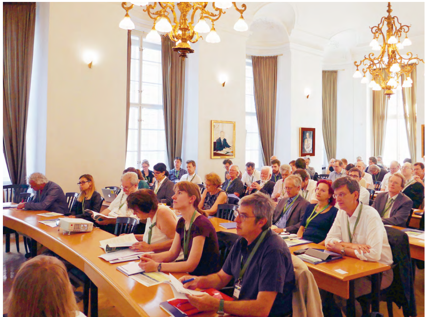
Abb. 1: Die TA17 im Sitzungssaal der Österreichischen Akademie der Wissenschaften.