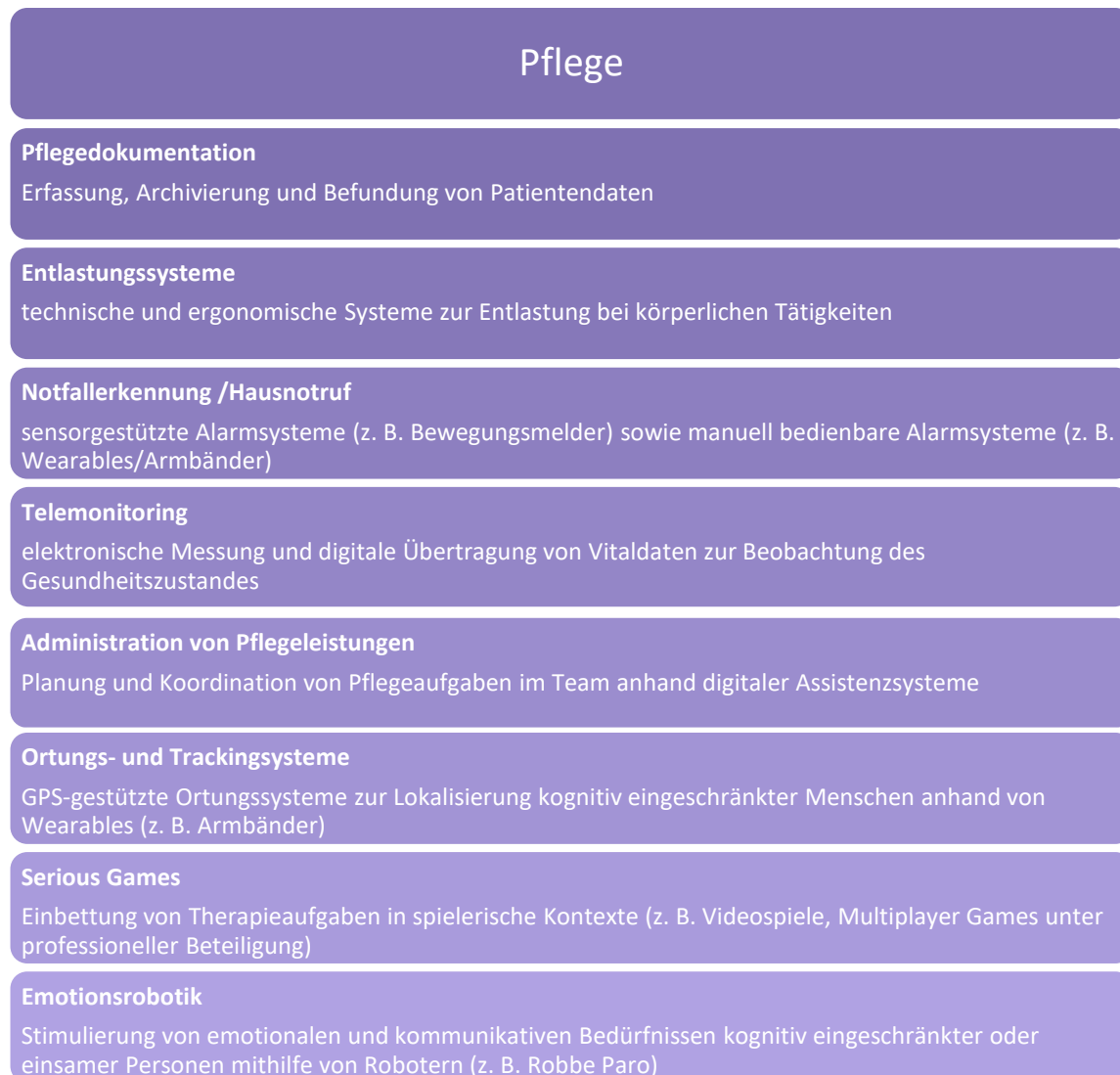
Abbildung 1: Anwendungsbeispiele digitaler Systeme in der Pflege

Quelle: eigene Darstellung; in Anlehnung an Roland Berger et al. 2017