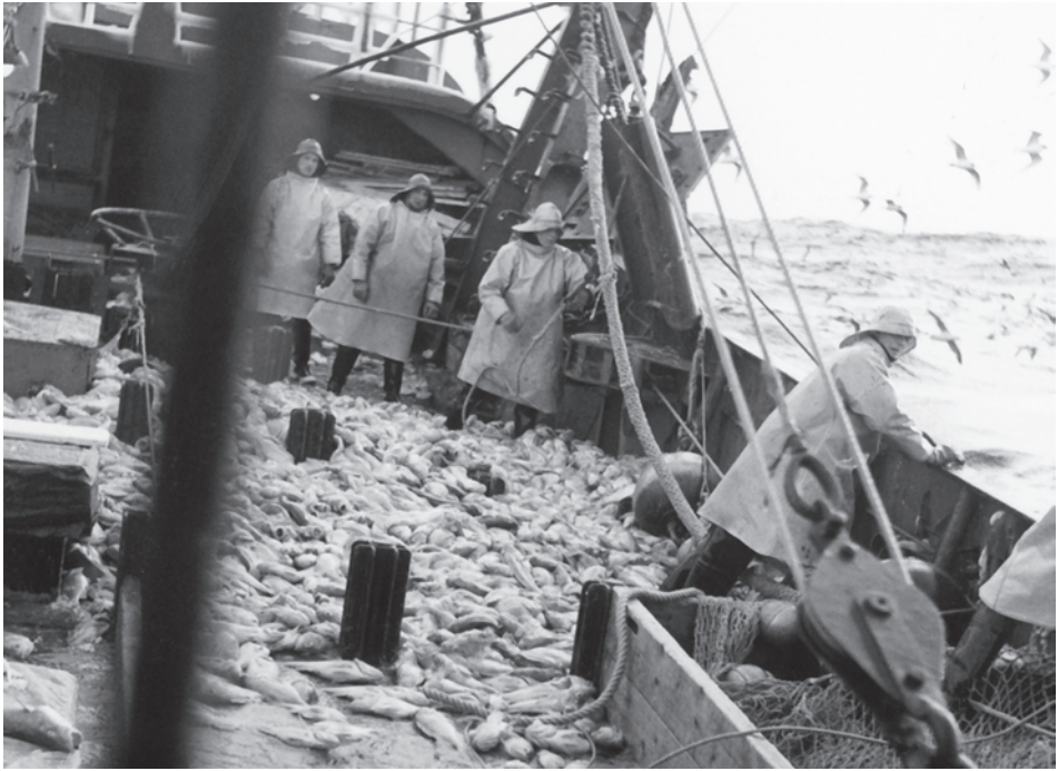
Abb. 5 Bis in die 1970er Jahre gehörten weite Ölröcke zur Arbeitskleidung der Hochseefischer. Sie stellten bei laufendem Gut eine nicht unerhebliche Gefahrenquelle dar. (Foto um 1960)