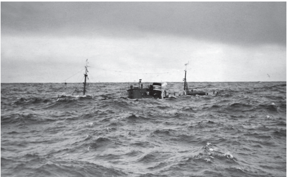
Abb. 2 Von dem Seitentrawler BX 448 FRIEDRICH BUSSE sind nur noch die Aufbauten zu sehen, da er sich in einem Wellental befindet. Diese Situationen gehörten zum Alltag der Hochseefischerei im Nordatlantik. (Foto um 1955; Archiv Historisches Museum Bremerhaven)