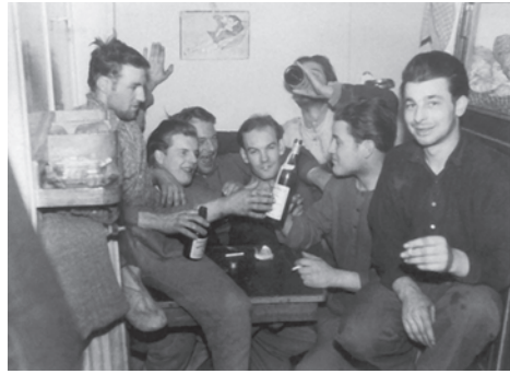
Abb. 10 Auf der Heimreise wurde auf den Seitentrawlern nach erfolgreichem Fischfang das »Erntedankfest« gefeiert. (Foto um 1958; Archiv Historisches Museum Bremerhaven)

mischen Charakter und diente auch der psychischen Aufarbeitung des vorangegangenen Arbeitsprozesses. 150 Nach der harten Arbeit im Gruppenakkord folgte mit dem »Erntedankfest« die bewusste Konstitution als soziale Gruppe. Insbesondere die älteren Hochseefischer berichteten über das »Erntedankfest«, während es bei der jüngeren Generation, die auf Fangfabrikschiffen gefahren war, unbekannt war. 151