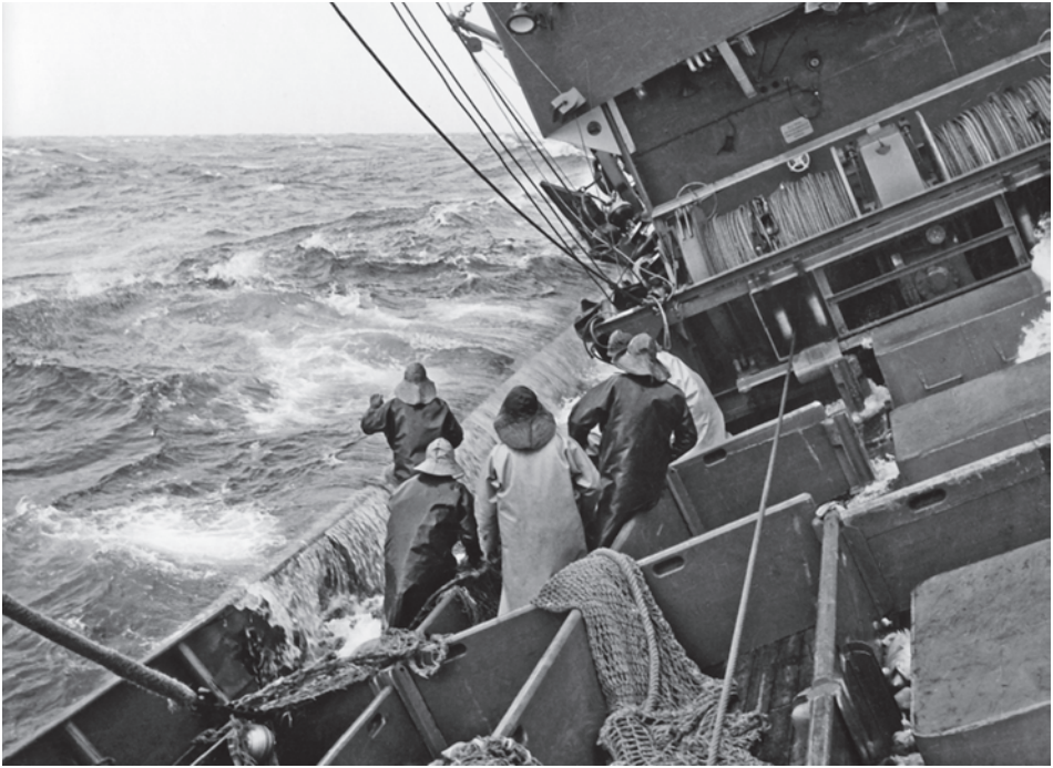
Abb. 1 Seitentrawler neigten auf Grund ihrer ungünstigen Trimmungseigenschaften bei schwerer See zu starken Krängungen, wie hier der Seitentrawler BX 637 MECHTHILD. (Foto von 1955; Archiv Historisches Museum Bremerhaven)