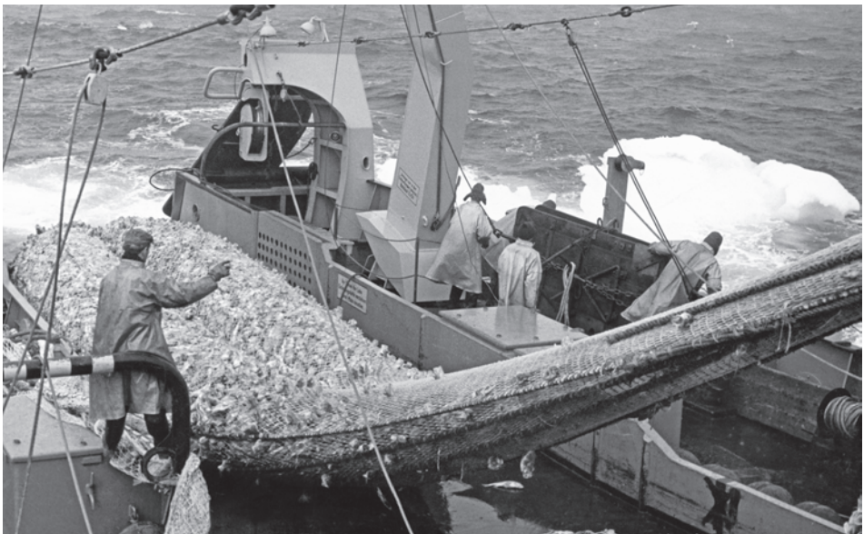
Abb. 6 Auch auf den Hecktrawlern wurde das Fangdeck häufig von Wasser überflutet. Sülle beschleunigten jedoch einen kontrollierten Abfluss. (Foto von 1961; Archiv Historisches Museum Bremerhaven)