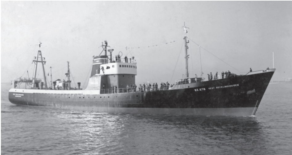
Abb. 9 Auf dem Hecktrawler BX 678 VEST RECKLINGHAUSEN kamen 1970 bei einem Feuer acht Seeleute ums Leben. (Foto um 1965; Archiv Historisches Museum Bremerhaven)

wortung dafür, dass Gefahren abgewendet und möglichst Fangglück herbeigeführt wurden. Die Anwendung der magischen Handlungen und Regeln an Bord funktionierte daher nur in einer solidarischen Gemeinschaft, in der der religiöse Glaube an übernatürlichen Beistand allgemein geteilt wurde. 111 Die älteren Besatzungsmitglieder hatten ihn stärker internalisiert als die jüngeren, die erst noch in alle Rituale und Tabus eingeführt werden mussten.