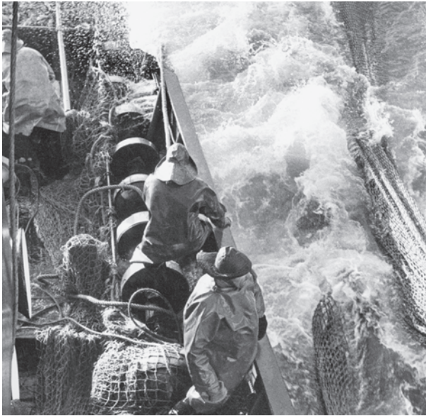
Abb. 3 Auf den Seitentrawlern waren die Hochseefischer häufig der Gischt und überkommendem Wasser ausgesetzt. (Foto um 1955)

seiner Erzählung die beruhigende Wirkung des Meeres, die jedoch nur bei gutem Wetter zu spüren gewesen sei. In Erinnerung kamen romantische Momente von schön anzusehenden Sonnenuntergängen: Ja, da hab' ich, bin ich so beim Auslaufen auf See, den Horizont, die Sonne geht unter. Das ist doch was Herrliches. 44