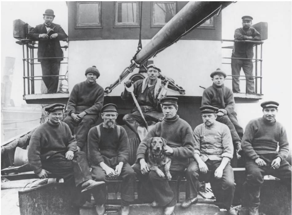
Abb. 8 Bereits auf den frühen Seitentrawlern, wie hier auf BX 65 DUCKWITZ, wurden Hunde als Glücksbringer mitgeführt. (Foto um 1907;)