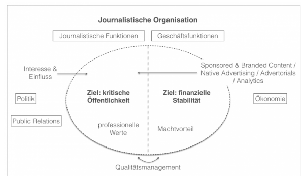
Abb. 1: The Wall becomes a Curtain

Der Druck auf den Journalismus steige insbesondere auch durch zunehmend professionelle Public Relations und Werbung, u.a. in Form von „Sponsored and Branded Content“, Advertorials, Native Advertising und Content Marketing (Benedetti 2015; vgl. Weischenberg 2004: 178; Gadringer et. al 2012; siehe auch Gonser/Rußmann 2017; Ruß-Mohl 2017).