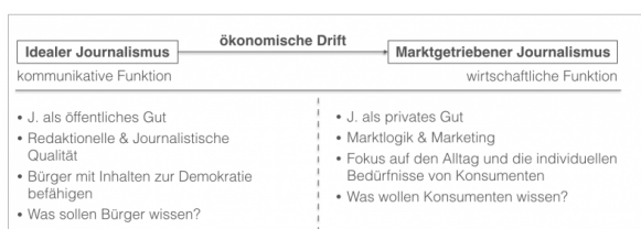
Abb. 2: Idealer vs. marktgetriebener Journalismus