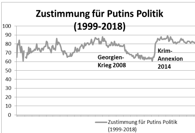
Abbildung 2: Zustimmung für Putins Politik in der russischen Bevölkerung (eigene Darstellung mit Daten des russischen Levada-Zentrums 1 ).

Außenpolitisch war die Großmacht durch die Konflikte in Georgien, Ukraine und im Besonderen auf der Krim zunehmend isoliert, die Wirtschaft schwächelte in der Folge deutlich und im Inland wurden die Proteste allmählich lauter. Putins Strategie in schwierigen innenpolitischen Situationen war keine Premiere: Außenpolitische Provokationen sollten innenpolitische Unruhen langsam ersticken und die eigene Position als Präsident und militärischer Oberbefehlshaber stärken. Die Annexion der Krim und die russische Einflussnahme im Syrien-Konflikt verfolgten vor allem eine Idee: Die Krisen konnte der Westen nur mithilfe und in Zusammenarbeit mit Russland lösen, Putin wurde damit zwangsweise gestärkt (Lamprecht/Ullrich 2016: 264 ff.). Genau das verdeutlicht auch der Blick auf die Zustimmungswerte für Putin.