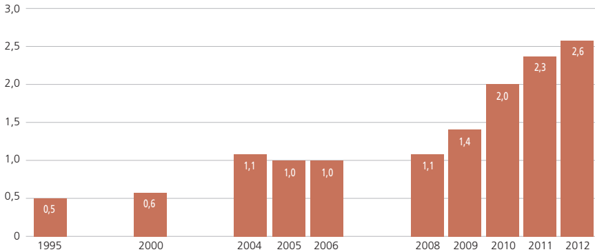
ABBILDUNG 2: ANTEIL STUDIENANFÄNGER_INNEN DES DRITTEN BILDUNGSWEGS 1995 BIS 2012 (IN PROZENT)