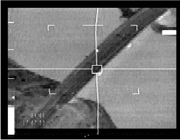
Abbildung 3: Still aus Auge/Maschine ; Harun Farocki

des zu gewährleisten. Die Entwicklung des motorisierten Flugverkehrs um die Jahrhundertwende ging Hand in Hand mit der militärischen Verwendbarkeit des Fliegens. Die Aufklärung feindlicher Stellungen aus der Luft und die Bombardierung wurden in größerem Umfang bereits im Ersten