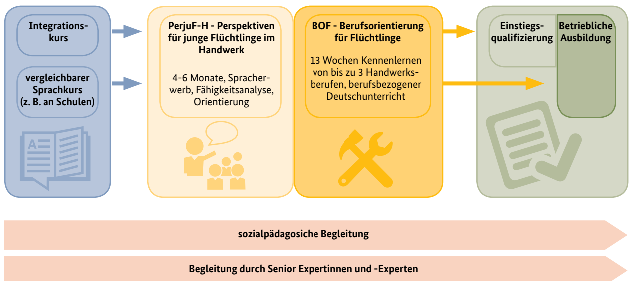
Abbildung 2: Initiative ‚Wege in Ausbildung für Flüchtlinge‘