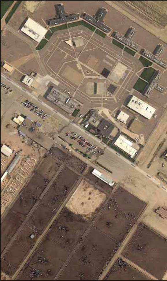
Foto 3: Four Mile Correctional Center, Canon City (Colorado). Oben im Bild die Anlagen zum Einschluss der Gefangenen, unten die zum Einschluss der Pferde