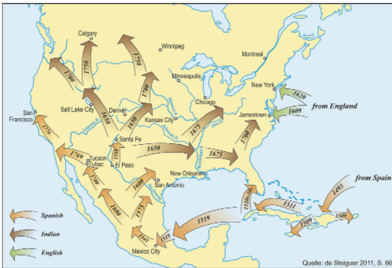
Abb. 2: Einführung und Ausbreitung des Pferdes in den USA

Karte: verändert nach de Steiguer 2011, S. 86