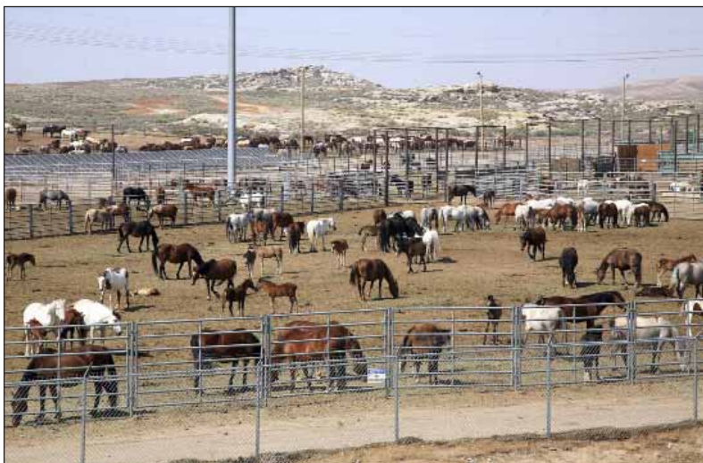
Foto 2: Rock Springs Wild Horse Holding Facility (Wyoming), in der das Bureau of Land Management etwa 800 Mustangs hält. Im Vordergrund das Gehege für Stuten mit in der Einrichtung geborenen Fohlen

Karte: verändert nach de Steiguer 2011, S. 86