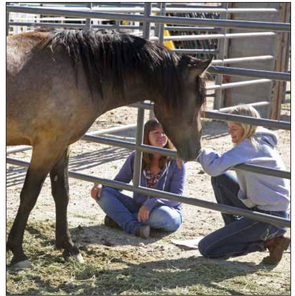
Fotos 4 und 5: Mustang Makover in Boise (Idaho) 2014. Links ein „Horseman“ bei der Präsentation eines Mustangs, rechts Kaufinteressentinnen beim Versuch der Kontaktaufnahme mit einem Pferd. Insgesamt wurden bislang 3600 Mustangs im Rahmen dieser Wettbewerbe vermarktet