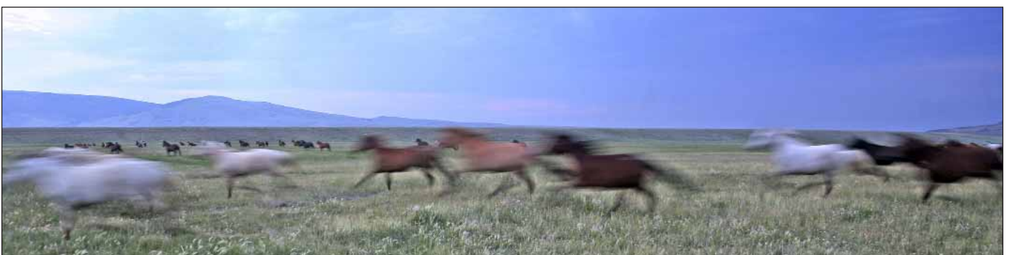
Foto 1: Mustangs auf der Deerwood Ranch (Wyoming). Derzeit hat das Bureau of Land Management Verträge mit 60 Farmern, auf deren Land eingefangene Wildpferde leben

Für gesellschaftliche Vorstellungen von Wildnis sind Wildtiere wie Mustangs – in Anlehnung an Macnaghten und Urry (1998) – konstitutiv. Der Umgang mit ihnen ist deshalb nicht zu verstehen, ohne die jeweils vorherrschenden gesellschaftlichen Diskurse über Wildnis zu kennen. Am Beispiel USA lässt sich nachvollziehen, wie sich solche Diskurse mit der Zeit verändern und wie dies immer auch mit einem Wandel der praktischen Mensch-Wildpferd-Verhältnisse einhergeht. So herrschte zur Zeit der Besiedlung des Westens eine eher liberalistische Vorstellung von Wildnis vor, die Wildnis als noch nicht für wirtschaftliche Zwecke verwertetes Land, als „Verfügmassse“ (Mutschler 2002, S. 211) ansah. In den USA führte dieses Verständnis von Wildnis dazu, dass wild lebende Pferde nicht geschützt, sondern nach primär ökonomischen Gesichtspunkten als natürliche Ressource oder natürliches Hindernis für wirtschaftliche Aktivität wahrgenommen wurden. Bis in die 1950er-