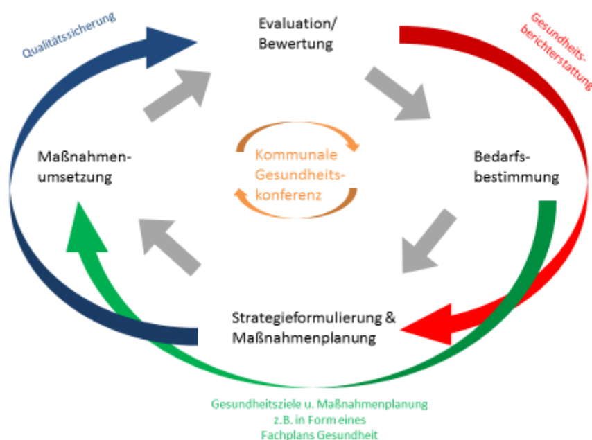
Abbildung 3: Der Public Health Action Cycle auf kommunaler Ebene