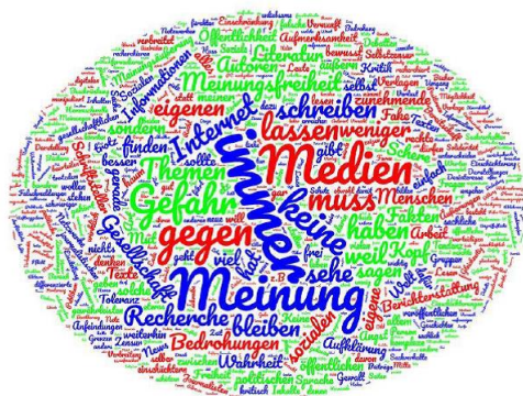
Abbildung 3: zukünftige Herausforderungen / Gefahren