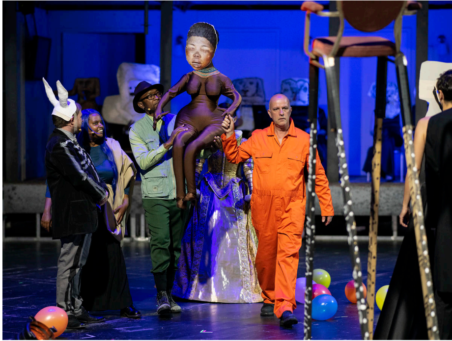
Abb. 1: Kolonialgeschichtlicher Dialog: Verweis auf Sarah Bartmann (L'AFRICAINNE IV: NISALB LIËFO - Verwandlung), Bühnen Halle / L'Africaine