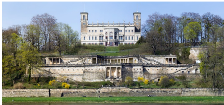
Schloss Albrechtsberg, eines der „Elbschlösser“ 9