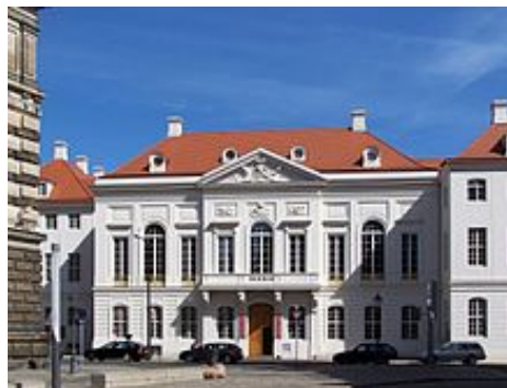
Kurländer Palais 7