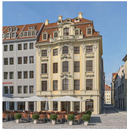
Dinglingerhaus (Jüdenhof) 6