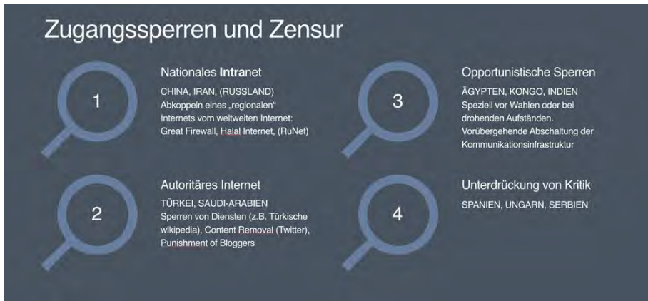
Abb. 2: Zugangssperren und Zensur (eigene Darstellung)

zur Einschränkung der medialen Vielfalt durch Rechtsbestimmungen und Medienkonzentration (z.B. in Spanien, Ungarn, Serbien). Im Folgenden werden einige Beispiele untersucht, die die typischen Methoden der Einschränkung aufzeigen und damit Ansatzpunkte für Gegenmaßnahmen durch digitale Plattformen und innovative Instrumente liefern.