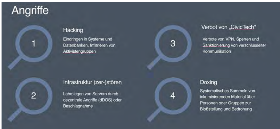
Abb. 3: Formen der Angriffe auf zivile Akteure (eigene Darstellung)

Zunehmend zielen illiberale Staaten bei repressiven Maßnahmen auf Akteure der Zivilgesellschaft. Standen im alten Mediensystem primär Journalisten im Fokus von Einschüchterung und Angriffen, geraten nun Aktivisten, Anwälte, Kulturschaffende oder einfache Bürgerinnen und Bürger ins Visier. Dabei werden vier Methoden angewandt (siehe Abb. 3).