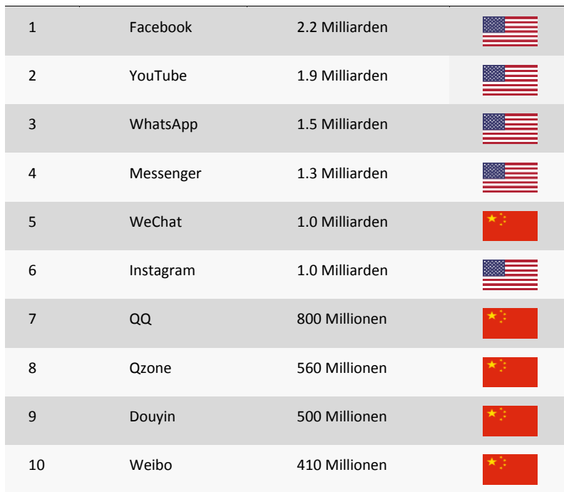
Tabelle 3: Die größten Social-Media-Plattformen weltweit 2018.

„Vereinfacht kann man sagen, dass es ein amerikanisches und ein chinesisches Internet gibt - mit Einschränkungen auch ein russisches - aber eben kein europäisches...“ (Hillje 2019: 164)