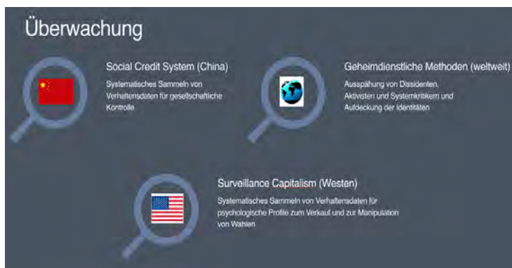
Abb. 1: Überblick über die drei Überwachungskomplexe im Internet (eigene Darstellung)

Das Internet galt durch freien Zugang, Interaktivität und Transparenz als mustergültige public sphere (Habermas 2006) für den gesamtgesellschaftlichen Dialog und damit zeitweilig auch als das bevorzugte Exportvehikel für die Förderung demokratischer Diskurse 15 weltweit. Es zeigte sich jedoch, dass diese Diskurse aus Perspektive der privatwirtschaftlichen Plattformbetreiber als User Generated Content ausschließlich den kostenlosen Rohstoff darstellen, welcher der Werbeindustrie zum Verkauf angeboten wird. Die Infrastruktur zur Optimierung dieser Werbeerlöse, das universelle Verfolgen ( Tracking ) jeder Äußerung und Interaktion der Nutzerinnen und Nutzer, wurde zu einer Überwachungs- und Manipulationsstruktur verfeinert, die bald auch Begehrlichkeiten von Regierungen und Geheimdiensten weckte. Das unterliegende technische Protokoll (TCP/IP) ermöglicht aber nicht nur das passive Mitschreiben, wer, wann, was zu wem gesagt hat, sondern auch die algorithmische Kontrolle darüber, wer, wann, was von wem zu hören oder zu sehen bekommt. Also das absolute Gegenteil dessen, was unter einem freien und transparenten Diskursraum verstanden wird.