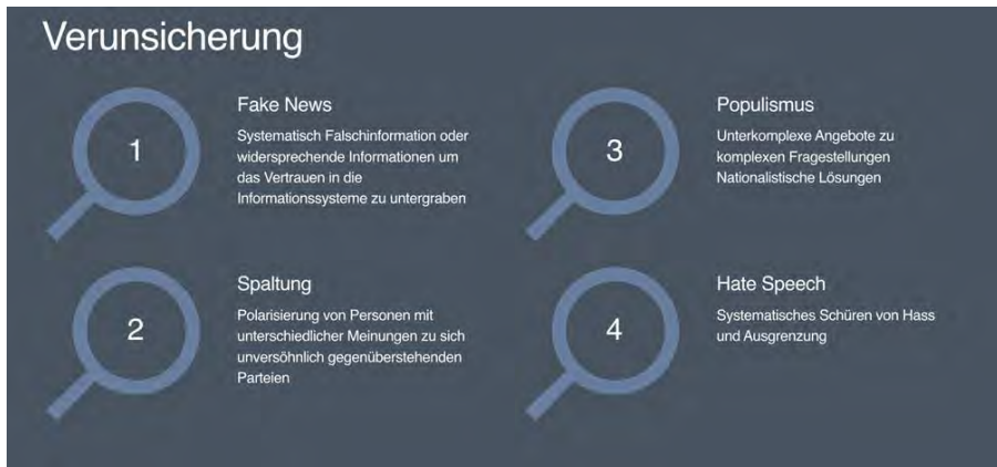
Abb. 4: Methoden der Verunsicherung (eigene Darstellung)

Die drei Phänomene werden hier nur insoweit angerissen, wie uns dies Aufschlüsse über die Verzerrung der Kommunikation im digitalen Raum gibt. Zur Vertiefung verweisen wir auf die aktuellen Beiträge von Limbourg/Grätz (2018) und Higgott/Proud (2017).