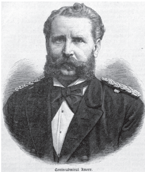
Abb. 2 Eduard Knorr (1840–1920), hier nach seiner Ernennung zum Konteradmiral 1883, war 1870 Kommandant des Kanonenbootes METEOR, stieg bis zum Kommandierenden Admiral auf und wurde 1896 in den Adelsstand erhoben.

1870/71 hatte die mit drei Geschützen bestückte METEOR unter Kapitänleutnant Eduard Knorr (1840–1920) vor Havanna ein erfolgreiches Seegefecht gegen ein etwas größeres französisches Kriegsschiff geführt: 6 Der französische Aviso BOUVET (700 Tonnen, fünf Geschütze, vier Drehbasen, 85 Mann Besatzung) hatte am 8. November 1870 den Hafen von Havanna verlassen, nach Ablauf der von den neutralen spanischen Behörden vorgeschriebenen 24-Stunden-Frist gefolgt von dem sehr kampfeslustigen Kapitän Knorr mit seinem Kanonenboot. Während des 2½-stündigen Seegefechts in den internationalen Gewässern vor Havanna hatte die METEOR einen französischen Rammversuch ausmanövriert, wobei die Schiffe unter einem Winkel von 5 Grad aneinander vorbeigeschrammt waren. Die METEOR hatte dabei den Großmast und Besanmast mitsamt der Takelage verloren. Durch einen glücklichen Geschütztreffer war jedoch die Maschine des französischen Kriegsschiffes außer Gefecht gesetzt worden. Der BOUVET war es allerdings ge-