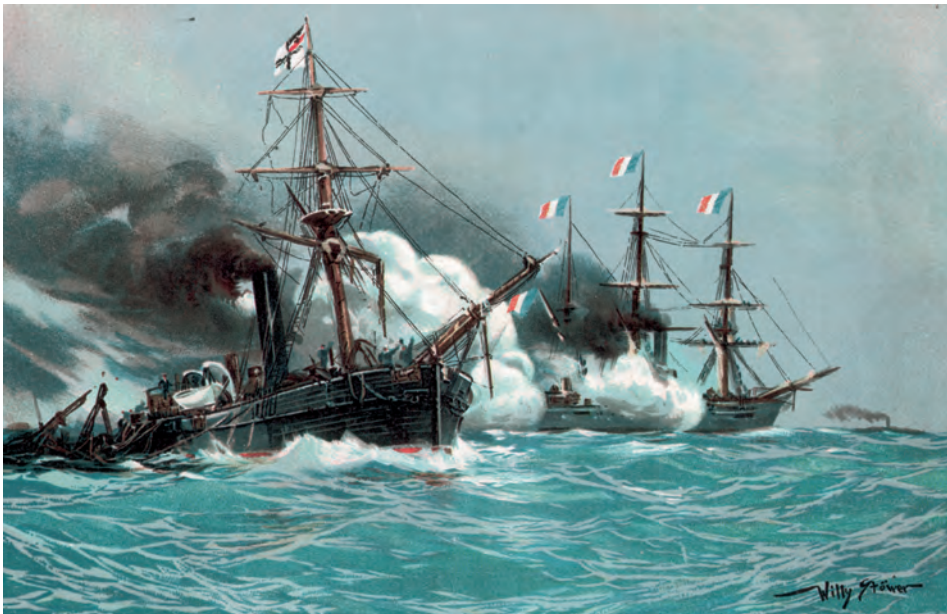
Abb. 3 Seegefecht zwischen dem Kanonenboot METEOR und dem Aviso BOUVET am 9. November 1870 vor Havanna. Farblithographie eines Gemäldes von Willy Stöwer.

In Frankreich wie in Deutschland, hier durch den bekannten Marinemaler Willy Stöwer, wurde der Kampf der beiden Schiffe vor Havanna in großformatigen Ölgemälden verewigt. Es ist deshalb kein bloßer Zufall, dass ab 1892 alle fünf Segelyachten Kaiser Wilhelms II. aufeinanderfolgend den Schiffsnamen METEOR führten. 8 Nach dem Ersten Weltkrieg trug dann ein Vermessungs- und Forschungsschiff der Reichsmarine den Traditionsnamen METEOR, das als erstes Schiff der Reichsmarine nach dem Kriege die deutsche Flagge im Ausland zeigte und die mehr als zwei Jahre dauernde atlantische Expedition durchführte . 9 Selbst zu Ende des Zweiten Weltkriegs führte ein Hilfsschiff der deutschen Kriegsmarine noch den Traditionsnamen METEOR. 10 Der gebürtige Saarländer Eduard Knorr avancierte am 14. Mai 1895 zum Kommandierenden Admiral der deutschen Marine und wurde am 18. Januar 1896 geadelt. Er galt als fähiger, aber etwas derber seemännischer Praktiker, hatte jedoch mit der eigentlichen Admiralstabsarbeit wenig im Sinn. Als er einmal von einem Admiralstabsoffizier ausgearbeitete, etwas