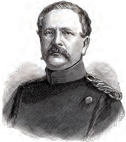
Albrecht v. Stosch.