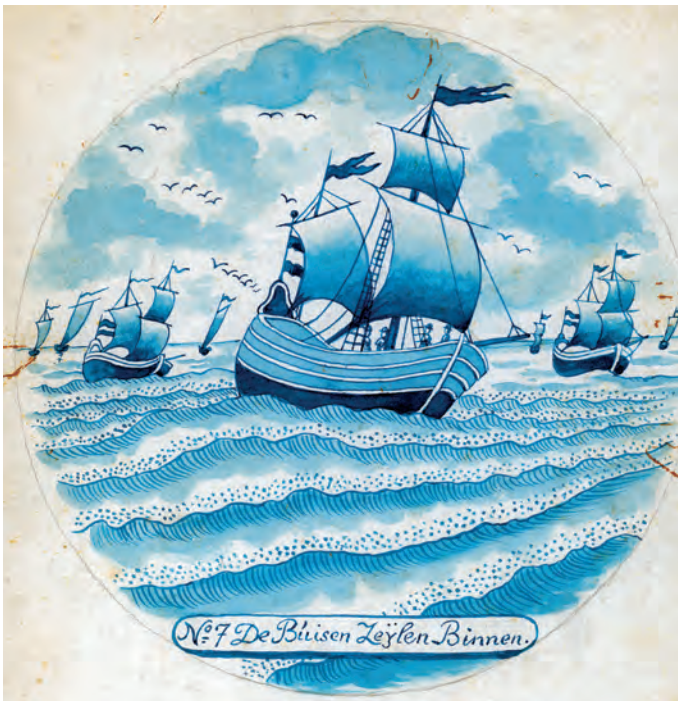
Abb. 8a+b Radierung Nr. 10 (oben) und Vorlage- blatt Nr. 7 (unten) zeigen die zurücksegelnde Büsenflotte.