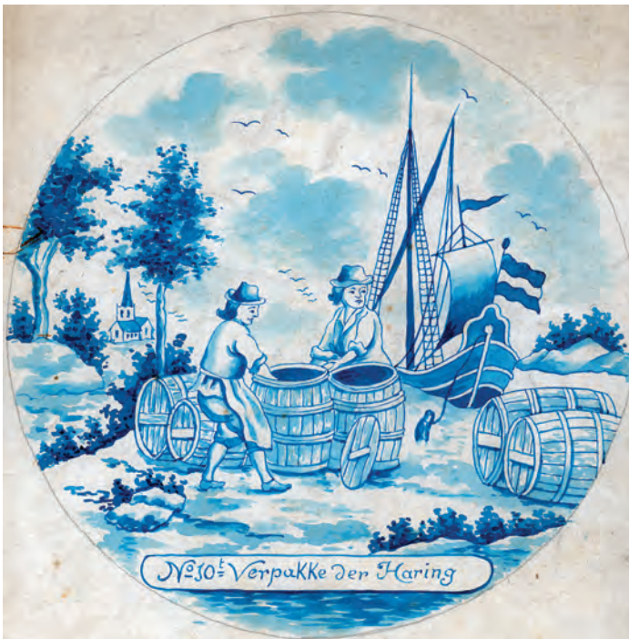
Abb. 12a+b Radierung Nr. 12 (oben) und Vorlageblatt Nr. 10 (unten) zeigen das Packen der Heringstonnen.