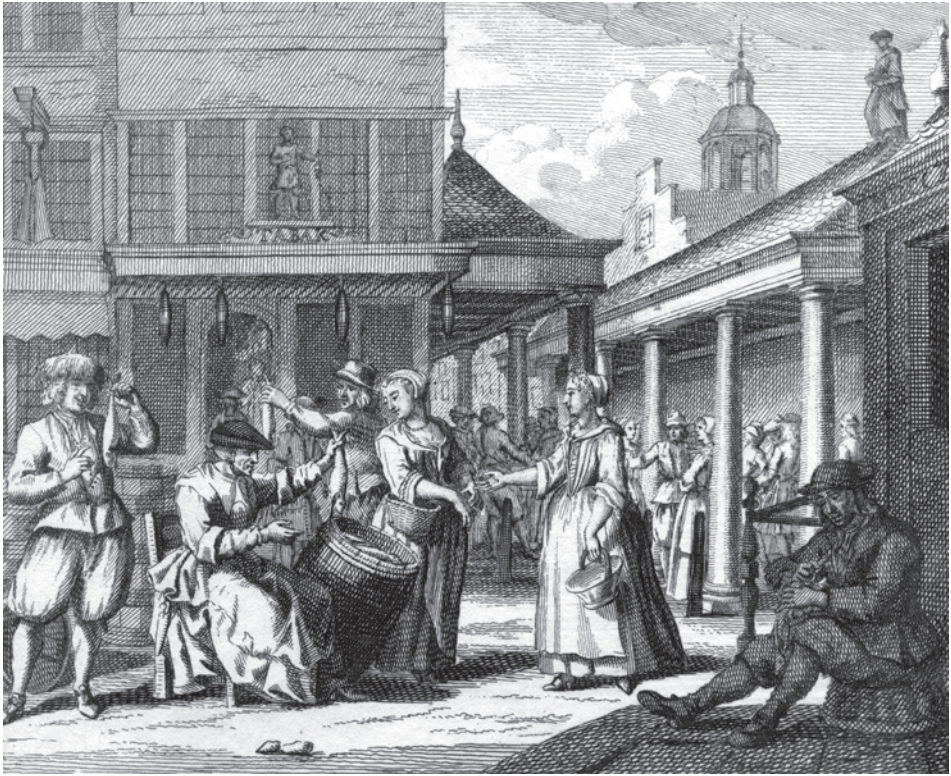
Abb. 11a+b Radierung Nr. 14 (oben) und Vorlage- blatt Nr. 8 (unten) zeigen das Verkaufen des Hering.