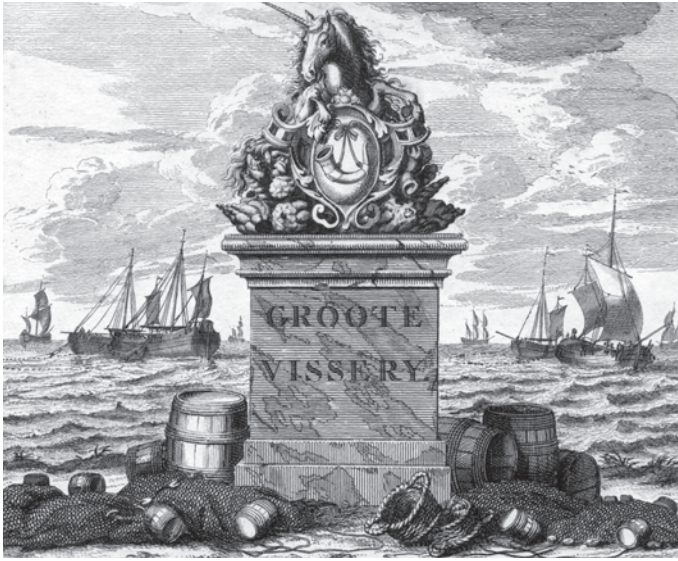
Abb. 1 Titelblatt der Radierungsserie »Grootte Vissery«, Amsterdam um 1725.

der Meulen (1698–1730) gestochen. Nach dem Titelblatt stellen 16 Blätter den Heringsfang dar und die übrigen 16 die Waljagd. 8 Auch nach den Waljagd-Radierungen fertigte dieselbe Manufaktur einen Satz von zwölf Fayencetellern an 9 , was hier aber nicht weiter verfolgt werden soll, denn nur für die Heringsteller lässt sich der Designvorgang in allen Einzelschritten genau nachvollziehen.