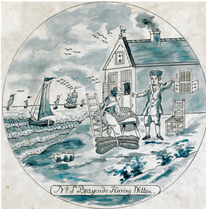
Abb. 2a+b Vorlageblatt Nr. 1 (unten). Wie die Radierungen, oben Nr. 2 der Serie »Grootte Visserij«, begannt auch der Tellersatz mit dem Knüpfen der Heringsnetze.