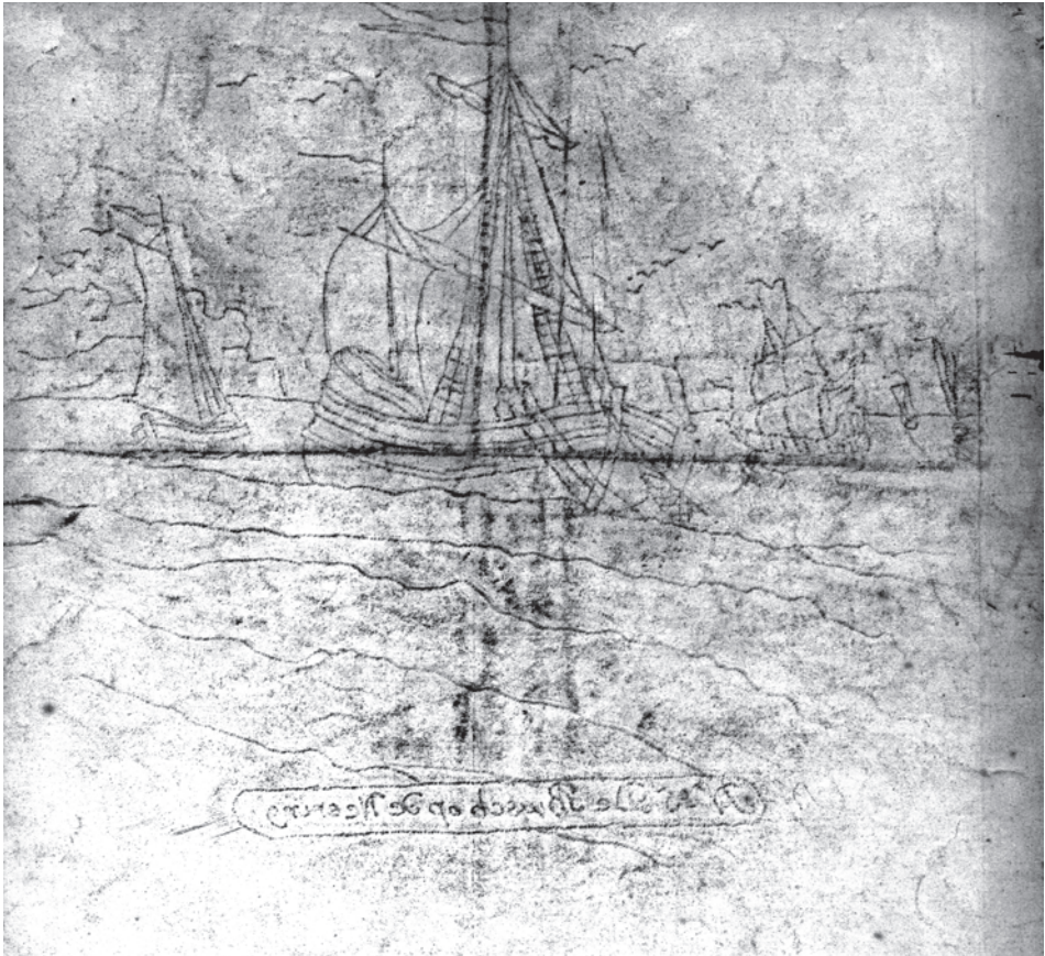
Abb. 7 Rückseite von Blatt 5 mit seitenverkehrtm Abdruck der zugehörigen Durchstaubschablone. (Archiv DSM)

Der an den Vorlageblättern des Deutschen Schiffahrtsmuseums ablesbare Arbeitsprozess verlief also bei den niederländischen Wandfliesen in genau gleicher Weise. Demnach haben auch für die Serienherstellung der Wandfliesen bereits Designer die nötigen Vorlageblätter entwor-