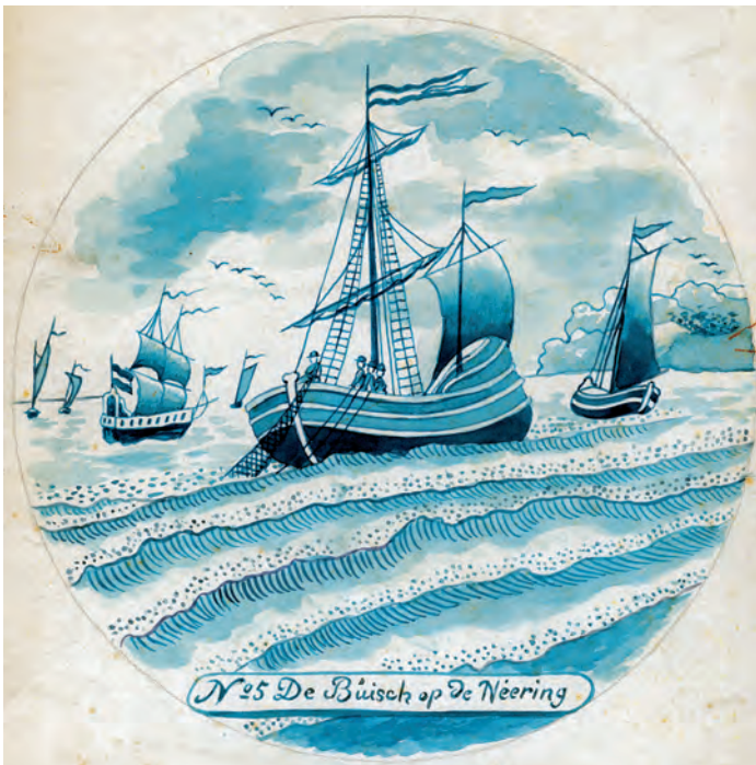
Abb. 6a+b Radierung Nr. 7 (oben) und Vorlageblatt Nr. 5 (unten) zeigen eine Büse auf dem Fangplatz: Mit dem gesetzten Besansegel fährt das Schiff langsam rückwärts und zieht dabei das Netz, das hier gerade eingeholt wird.