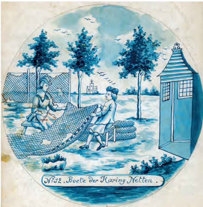
Abb. 14a+b Radierung Nr. 17 (oben) und Vorlageblatt Nr. 12 (unten) zeigen das Ausbessern der Heringsnetze. Das Blatt beschließt damit den Telleratz, der mit dem Knüpfen der Netze begann. (Archiv DSM)