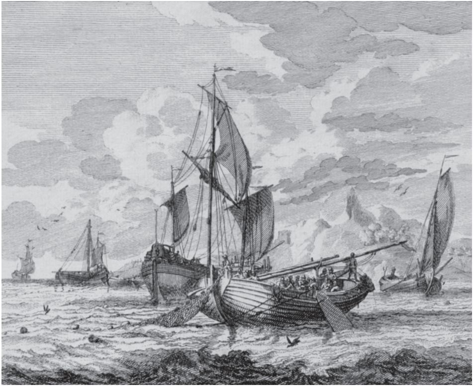
Abb. 18a+b Radierung Nr. 9 von van der Laan (oben) zeigt eine Seeschute auf dem Fangplatz. Darunter Vorlageblatt Nr. 6 mit der für die Teller vereinfachten Wiedergabe der Radierung und gleich drei Schreibfehlern beim Schiffstyp.