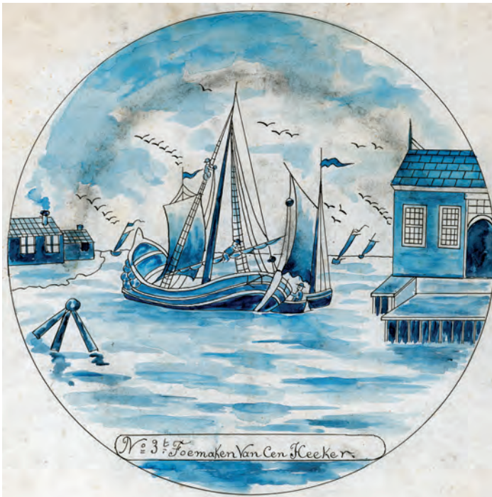
Abb. 10a+b Radierung Nr. 5 (oben) und Vorlageblatt Nr. 3 (unten) zeigen das Auftakeln eines Huckers im Heimathafen. Wo die Durchstaubschablone in den Anstieg zwischen Spiegel und Fahne des Tellers hineingedrückt werden musste, hat sich eine halbkreisförmige Kohlenstaubzone abgesetzt und auf das Vorlageblatt abgefärbt.