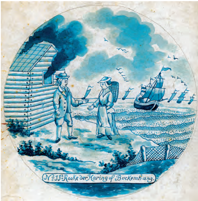
Abb. 19a+b Radierung Nr. 16 (oben) und Vorlageblatt Nr. 11 (unten) zeigen das Räuchern der Heringe.