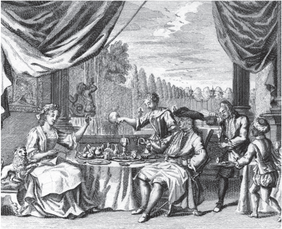
Abb. 17a+b Radierung Nr. 13 (oben) und Vorlage- blatt Nr. 9 (unten) zeigen ein Festessen mit Hering in der oberen Gesellschafts- schicht, wie am parkartigen Barockgarten zu erkennen ist.