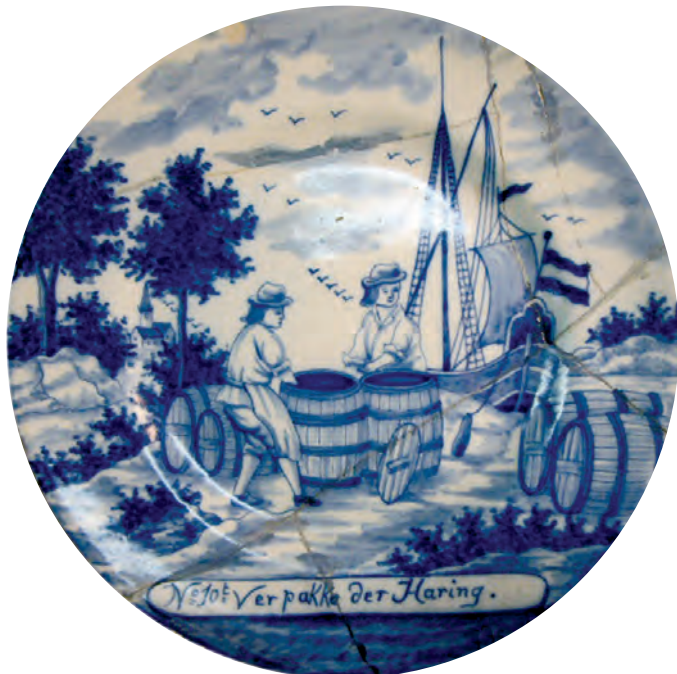
Abb. 13 Der nach Vorlageblatt Nr. 10 bemalte Teller nach dem Glasurbrand, betitelt N° 10 'Verpakke der Haring. (DSM, Inv. Nr. I/10445/09a)

Genau in gleicher Weise malte der Maler auch den Teller Nr. 12 »Boete der Haring Netten« (= Das Ausbessern der Heringsnetze). Wieder wurden die Punktreihen der Schablone in kräftigem Blau mit feinem Pinsel sehr genau nachgezogen (Abb. 14–15), wobei die Maschen der Netze und die Sprossen der Fenster sogar feinteiliger dargestellt wurden als auf der Vorlage. Im Übrigen nahm sich der Maler beim Schattieren der Kleidung der Personen und bei der Gestaltung der Landschaft die schon für Teller 10 aufgezeigten Freiheiten gegenüber der Vorlage heraus. Probleme hatte er nur bei der Wiedergabe des Hauses, denn dieses war dem Designer der Vorlage perspektivisch gründlich missraten. Der Maler hat sich zwar nicht getraut, die