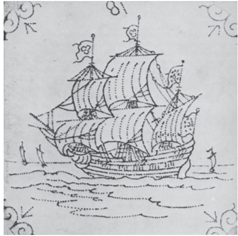
Abb. 5 Durchstaubschablone für eine Fliese mit Schiffsbild. (DSM; aus: Heinrich Stettner: Schiffe auf Fliesen . Bremerhaven 1976, S. 59)

Damit jeder Maler die Übertragung auf den Teller ohne zeitaufwändiges Vermessen verzerzungsfrei durchführen konnte, fertigte der Designer in einem dritten Schritt von der Papiervorlage noch eine Durchstaubschablone an, die in Holland »Sponse« hieß. Sie bestand aus starkem Papier, auf das er die Umrisse der zu übertragenden Darstellung zunächst mit feinem Stift zeichnete, um dann mit einer Nadel in kurzen regelmäßigen Abständen Löcher in die Linien der Zeichnung zu stechen, sodass die gezeichneten Konturen in Form von Lochreihen sichtbar wurden (vgl. Abb. 5). 12 Diese Schablone legte der Maler auf den zu bemalenden Teller und betupfte sie mit einem Leinenbeutel, der Holzkohlenstaub enthielt. Der Staub drang durch die Löcher der Schablone, haftete auf der noch ungebrannten Glasur und gab darauf die Linien der Zeichnung durch feine Punktreihen wieder. Nach deren Muster trug der Maler mit unterschiedlichen Pinseln die Farbe (hier Manganblau) auf, die vor dem Brennen sehr unscheinbar aussieht. Beim zweiten Brand verbrannten die Kohlenstaubpunkte, die Farbe verband sich mit der Glasur und erhielt ihr leuchtend blaues Aussehen.