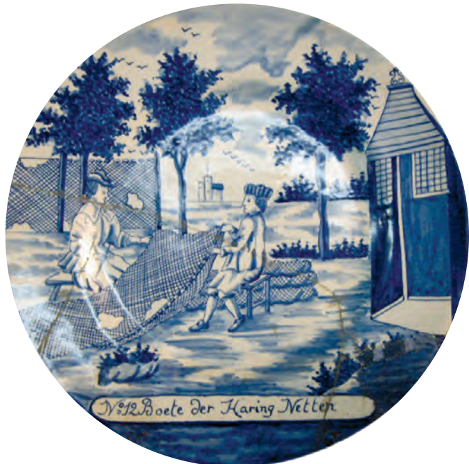
Abb. 15 Der nach Vorlageblatt N° 12 bemalte fertige Teller, betitelt N° 12 Boete der Haring Netten. (DSM, Inv. Nr. I/10445/09b)

Das Zentralmotiv, ein einmastiges Segelboot, brachte der Maler mit einer Durchstaubschablone auf die Fliese, zog die Rumpfkonturen mit raschem Pinsel nach und zeichnete schon das Segel mit leichten Unterschieden, bei (b) mit längerer Rah und einer Segelbahn mehr als bei (a).