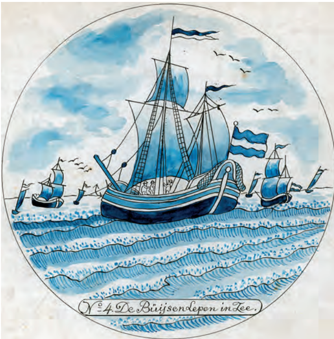
Abb. 4a+b Radierung Nr. 11 (oben) und Vorlageblatt Nr. 4 (unten) zeigen, wie eine Flotte von Büisen zu den Fangplätzen ausläuft.