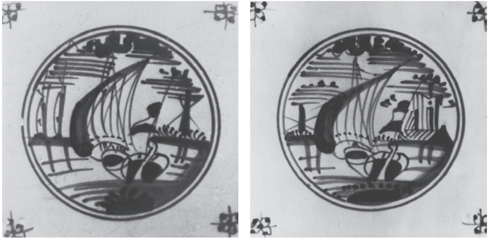
Abb. 16a+b Zwei Fliesen mit Schiffsbild, das jeweils mit Durchstaubschablone übertragen wurde; die umgebende Wasserlandschaft gestaltete der Maler frei, u.a. mit gängigen Versatzstücken. (DSM; aus Heinrich Stettner: Schiffe auf Fliesen . Bremerhaven 1976, S. 61, Fliese W1, b und d)

Die umgebende Wasserlandschaft gestaltete er dann mit klischeehaften Versatzstücken (Windmühle, Segelboote, Haus mit Turmruipe) ganz frei und in wechselnden Kombinationen, wobei er nur die von der Schablone vorgegebene Horizontlinie einhielt und Wasser und Himmel mit routinierten Pinselstrichen ins Bild setzte. Die formelhaften Versatzstücke gehörten so sehr zum gängigen Repertoire der einfachen Maler in den Manufakturen, dass sie damit mühelos auch die Hintergründe der Fayenceteller belebten, was schon der Designer auf den Vorlageblättern einkalkulierte (Segelboote: Abb. 4, 6, 8, 10; Häuser und Turm: Abb. 11–15). Ebenso wie für die Einzelfliesen enthielten auch die Durchstaubschablonen für die seit 1729 nachweisbaren Fliesentableaus mit Schiffen nur die wichtigsten Linien der Abbildungen, aber die Darstellung der Wolken, Blätter, Wellen, Vögel und Schattenpartien sowie des Bodens im Vordergrund blieb dem Künstler überlassen. Dadurch ist die Handschrift (Pinselführung) des jeweiligen Malers zu erkennen und relativ sicher zu bestimmen. 24