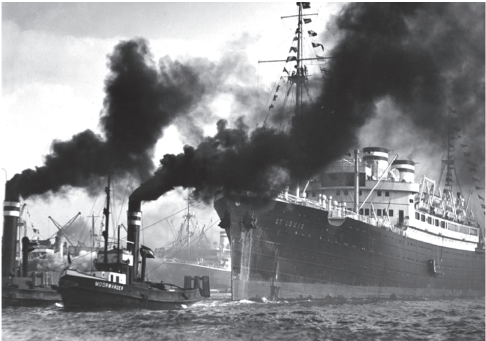
St. Louis unter Dampf, von Hamburger Hafenschleppern flankiert, 1930er Jahre.

St. LOUIS, in deren Schornsteinrauch deutlich Jewish refugee ship ( Jüdisches Flüchtlingschiff ) zu lesen ist, unterhalb der Freiheitsstatue vorbei. Unter dieser Karikatur von Fred Packer steht groß Ashamed ( Beschämt ).