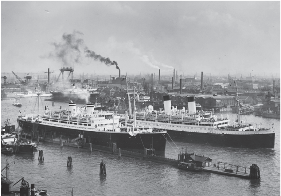
St. Louis in den 1930er Jahren im Hamburger Hafen, an ihrer Backbordseite die MONTE ROSA der Hamburg-Süd.