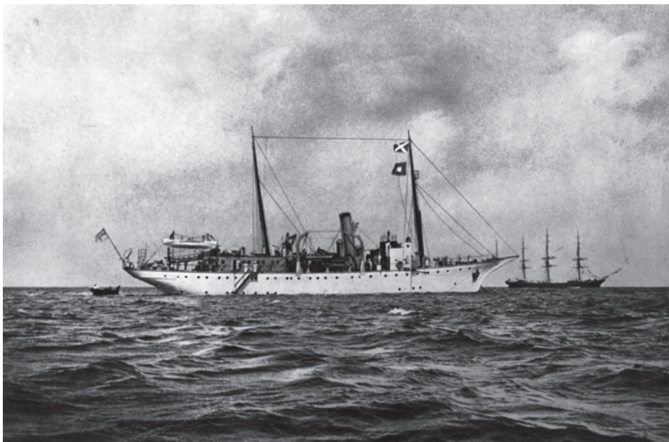
Abb. 2 Vermessungsschiff PLANET der Kaiserlichen Reichsmarine. (Aus: Forschungsreise S.M.S. »Planet« 1906/07. Herausgegeben vom Reichs-Marine-Amt. Bd. 1: Reisebeschreibung. Berlin 1909, Frontispiz)