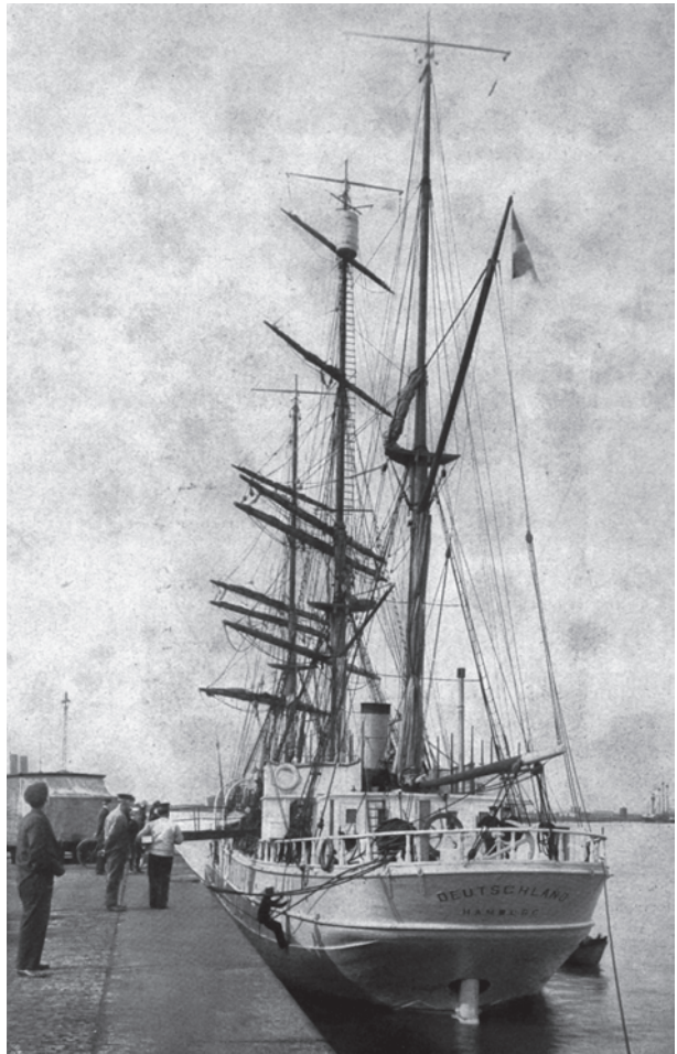
Abb. 3 Expeditionsschiff DEUTSCHLAND der Deutschen Antarktischen Expedition. (Aus: Karl Kollbach: Der Südpol. [= Velhagen & Klasings Volksbücher, Nr. 30]. Bielefeld, Leipzig 1911, S. 31)

Wenn Naturforscher die geographischen Aufgaben, die nun in den Vordergrund treten, aufnehmen, wenn man den höchsten Berg auf der Erde besteigt, und den Nordpol im Überflug photographiert, muss man den Wert, den die Deutschen in ihrer systematischen zielbewussten Arbeit geleistet haben, hochschätzen, die sie in dem weiten Arbeitsfeld der südlichen Zonen