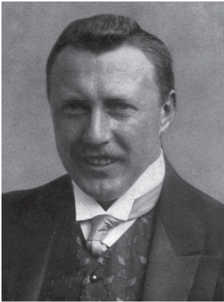
Abb. 6 Wilhelm Filchner (1877–1957), Forschungsreisender. (Aus: Karl Kollbach: Der Südpol. [=Velhagen & Klasing's Volksbücher, Nr. 30]. Bielefeld, Leipzig 1911, S. 30)

Dass es zu Spannungen gekommen war, hatte verschiedene Gründe. Der wohl wichtigste lag in dem Umstand, dass bei der Planung das Zusammenwirken zweier »Welten« in Kauf genommen worden war. Der großbürgerlich aufgewachsene Offizier Filchner, ohne jegliche See-Erfahrung, wollte bis zu drei Jahre lang auf einem einzelnen Schiff mit 35 überwiegend erfahrenen Männern unter extremen Randbedingungen in der Antarktis spektakuläre geographische Entdeckungen machen. Mit der rein wissenschaftlichen Fragestellung, ob es zwischen dem Weddell- und dem Ross-Meer unter der antarktischen Eiskappe eine ozeanische Verbindung gebe, hatte Filchner um finanzielle Unterstützung geworben. Bekommen hatte er sie jedoch letztlich durch die Bemerkung, dass die Suche am Südpol vorbeiführen würde, denn zu jener Zeit bestand ein großes öffentliches Interesse daran, welcher Nation es zuerst gelingen würde, den Südpol zu erreichen. In seinem Buch über die Expedition (1922) hat Filchner selbst ausdrücklich erwähnt, dass dies nicht sein Ziel gewesen sei, und auch bei der Benennung seines Unterneh-