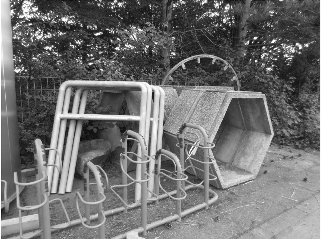
Abbildung 2: Foto aus dem MDP 2b (Fulda-Ziehers-Süd), das allen Kindern vorgelegt wurde

Deutlich wurde, dass die Fotos gut dazu geeignet waren, Assoziationsketten anzuregen, die sich auf lebensweltliche Erfahrungen oder auf Weltsichten bezogen. Während manche Kinder zum pragmatischen Abarbeiten neigten, verfassten andere längere Beschreibungen oder Erzählungen. Nicht selten wurden Bezüge zu gesellschaftlichen Problemen hergestellt oder die Sicherheit im sozialen Raum thematisiert 4 . Bild und Sprache sind dabei im Rahmen der Fotofrage nicht als voneinander unabhängige Repräsentationsformen zu verstehen – Bilder erzeugen auf eigenständige Art und Weise Bedeutungen und Sinn (vgl. Breckner 2010). So wird auch in den sequenziellen Analysen der Transkripte zur Fotofrage sichtbar, wie Konstruktionen von Kindern und Kindheit(en) interaktiv erzeugt werden.