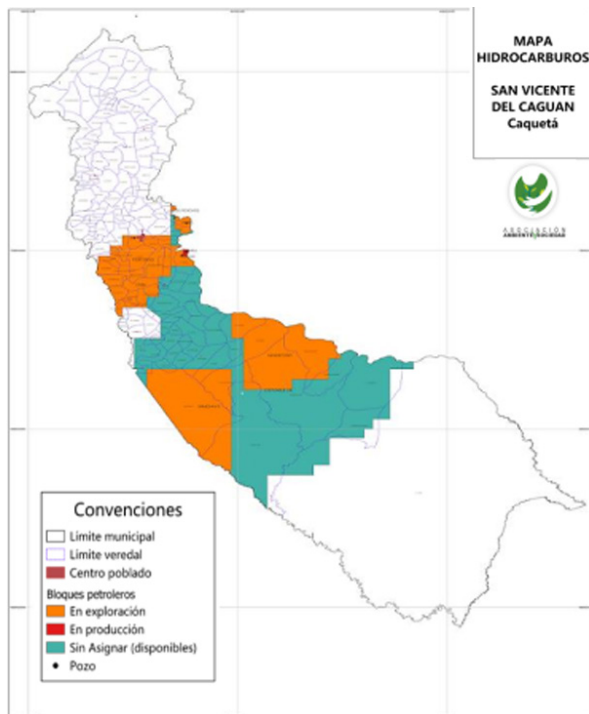
Mapa 1. Bloques petroleros en San Vicente del Caguán