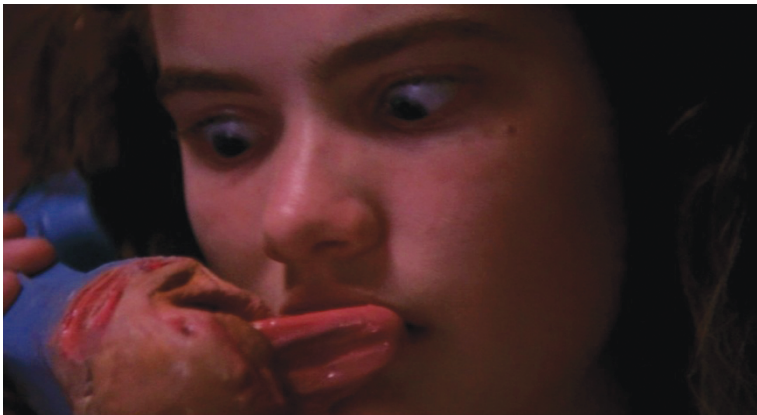
Abb. 5. Der Telefonkuss

und eine Face-to-Face-Kommunikation zu Glen zu errichten. Als sie aus dem Zimmer treten will, holt das Läuten des Telefons sie wieder zurück. »[D]as Recht, zu beliebiger Zeit an beliebigem Ort einen beliebigen Menschen an den Apparat zu rufen« ist eine Form von Macht 241 – umso mehr wenn die Beliebigkeit dieser Faktoren absolut ist, da sie nicht an das Vorhandensein eines an ein Netzwerk angeschlossenen Telefongeräts gebunden ist. Nancy schreitet langsam, wie in Trance, zum Telefon zurück und hebt in einer Nahaufnahme das Ende des abgerissenen Kabels, um es anschließend entsetzt anzuschauen und den Zuschauenden erneut zu verdeutlichen, dass es hier nicht mit rechten Dingen zugeht. Das hält sie allerdings nicht davon ab, dem Ruf des Telefons zu folgen und den Hörer abzunehmen. Trotz aller Unregelmäßigkeiten eröffnet ihr vages »Hello« das Gespräch, woraufhin aus dem Hörer die Stimme Freddys ertönt: »I'm your boyfriend now, Nancy.« Während Nancy noch erstarrt zum Hörer schielt, ergreift dieser Aktion – die Sprechmuschel wird zu Kruegers verbranntem Mund, aus dem sich sogleich seine Zunge herausschiebt und mit Schmatzgeräuschen Nancys Mund leckt (Abb. 5).