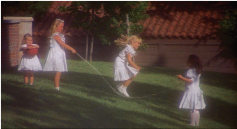
Abb. 2. Die seilhüpfenden Mädchen bei der Schule

eine Art vorgelagerte Sound Bridge bildet, da er diegetisch zur nächsten Einstellung gehört. Nach dem Schnitt am Ende des ersten Verses sehen wir kleine Mädchen im Tageslicht auf einer Wiese seilhüpfen (Abb. 2), allerdings ist nicht erkennbar, dass sie den Reim aufsaugen. Das extradiegetisch ertönende Lied wird also an die Mädchen gekoppelt, ohne dass nahegelegt würde, es sei Teil des Filmgeschehens. Aufgrund der Überbelichtung scheinen die weißen Kleider der Mädchen zu leuchten, die gesamte Szene ist weichgezeichnet. Die somit ästhetisch als Traum markierte Einstellung, sorgt für Verwirrung: Ist Tina, mit dem Kreuzifix in der Hand, wieder eingeschlafen und träumt von den Mädchen, ohne dass wir sie aus diesem Traum erwachen sehen? Ist dann alles, was jetzt folgt, ein Traum? Oder sind die Mädchen diegetischer Teil der folgenden realen Szene, die sich hier mit Tinas Traum vermischt? Warum sind sie nicht mehr da, als wir dieselbe Wiese später im Hintergrund noch einmal sehen (05)?