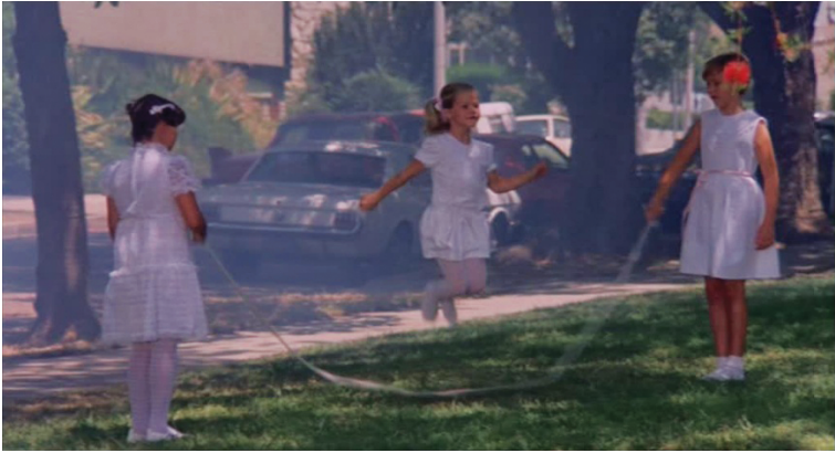
Abb. 3. Die seilhüpfenden Mädchen am Ende des Films.

Als das Auto mit den vier Teenagern wegfährt, werden auf dem Rasen neben der Straße wieder seilhüpfende, weiß gekleidete Mädchen sichtbar, zu deren rhythmischem Hüpfen das Freddy-Lied ertönt (Abb. 3). Auch hier gehört dieses zum extradiegetischen Ton – sie singen es nicht –, allerdings verstummt es nach dem Schnitt zurück auf Nancys noch immer vor der Haustür stehende Mutter. Das kleine Fenster in der Tür wird jetzt von innen zerbrochen, daraus schnell Kruegers Arm hervor und zerrt die Frau durch die enge Öffnung ins Hausinnere. Wieder sind die Mädchen zu sehen, ihr Lied setzt erneut ein und wird lauter, als das Bild ausblendet.