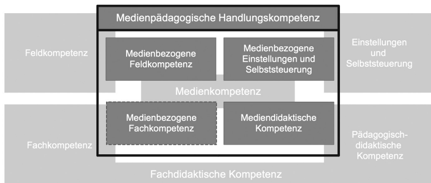
Abb. 1: Medienpädagogische Kompetenz von Lehrenden in der Weiterbildung Quelle: eigene Darstellung