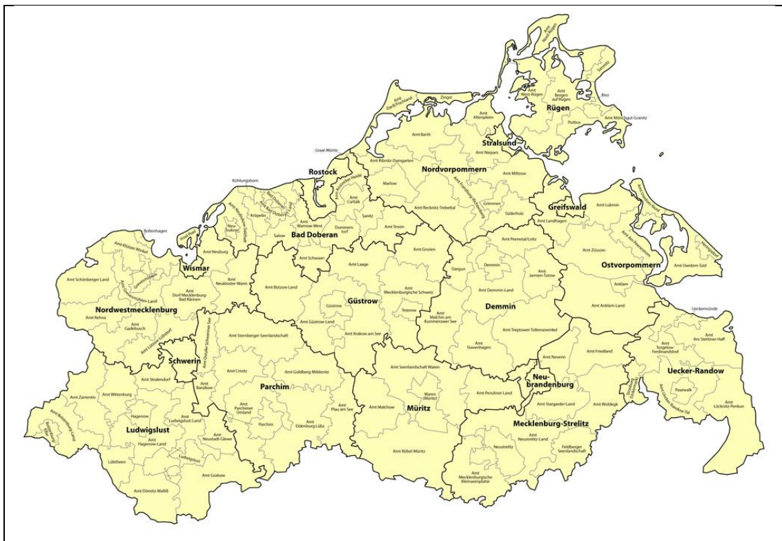
Abb. 2: Landkreise des Landes Mecklenburg-Vorpommern von 1994 bis 2011 (Dörrbecker 2009).

Nach der Gründung Mecklenburg-Vorpommerns errichtete das Land eine kommunale Selbstverwaltung in der Gebietsstruktur der DDR. Es gab 31 Landkreise, sechs kreisfreie Städte und 1.117 Städte und Gemeinden, die allerdings weder den finanziellen Hintergrund noch die nötige Größe hatten, um ihre Aufgaben bewältigen zu können. So hatten 90 Prozent der Gemeinden weniger als 2.500 Einwohner und die Landkreise durchschnittlich 40.000 Einwohner. Das führte auf kommunaler Ebene zum Zusammenschluss von Gemeinden zu Ämtern, welche die Verwaltungsaufgaben übernahmen, während die Gemeinden ihre Selbstständigkeit behielten (Foißner 2006: 173). Auf Landkreisebene kam es 1994 zu einer Gebietsreform. Seitdem gliederte sich Mecklenburg-Vorpommern in zwölf Landkreise und sechs kreisfreie Städte (Foißner 2006: 173), sodass sich die Gliederung des Landesgebiete wie in Abbildung 2 darstellte.