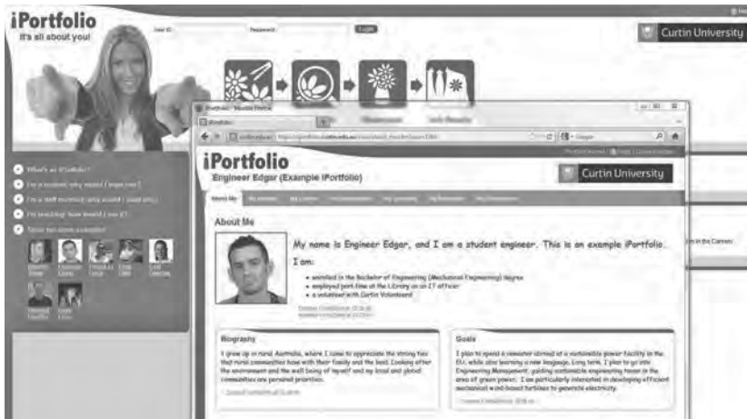
Das iPortfolio dokumentiert zum Beispiel Projekte und Leistungsnachweise von Studenten.

Tutorials: NewsU-Tutorials sind Einführungen zu Web-Anwendungen und -Tools. Mit Schritt-für-Schritt-Anleitungen erklären sie grundlegende Funktionen dieser Anwendungen. Nutzer können sie starten und stoppen, so oft sie möchten.