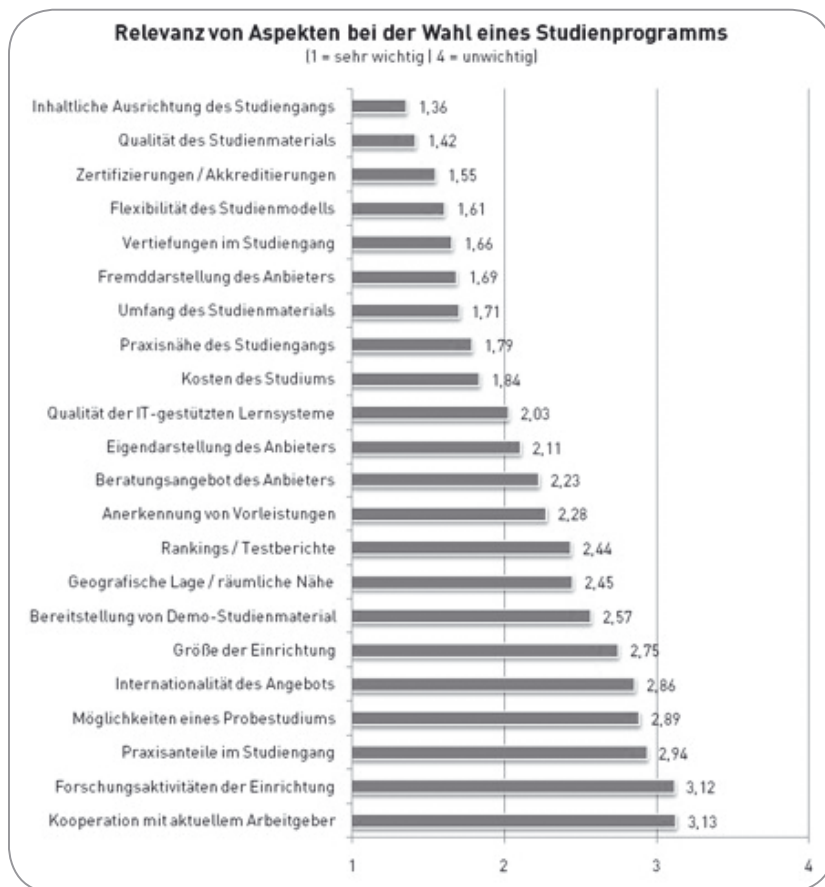
Abb. 2: Aspekte der Studienwahl