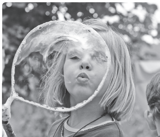
Die Leistungen der Kinder- und Jugendhilfe einzusparen hätte verheerende Auswirkungen.

wirklicher Anreiz, in eine stärkere und verbindlichere Finanzierung der Familienbildung einzusteigen. Ganz im Gegenteil: Gerade Kommunen mit besonderen Haushaltsproblemen und besonderem Bedarf an Kinder- und Jugendhilfeleistungen sparen an den (scheinbar) freiwilligen Leistungen, während ‚reiche‘ Kommunen vor Ort investieren. Diese haushaltspolitisch zwangsläufige Bewegung führt letztendlich zu dem Ergebnis einer weiteren Polarisierung der regionalen Lebensbedingungen von Familien.