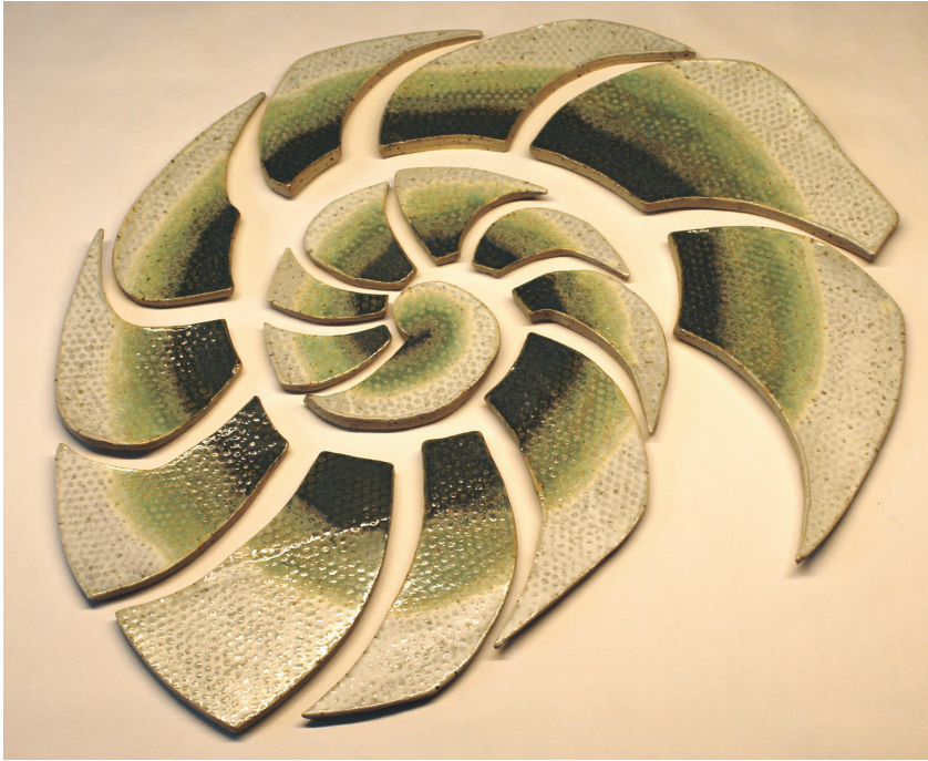
Abb. 1: Das Schneckenhaus