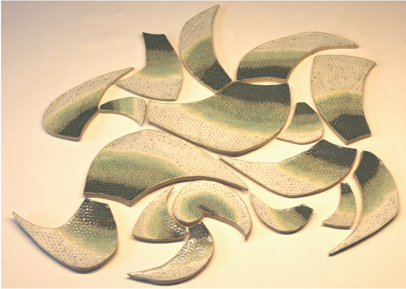
Abb. 2: Das Tribal

Eine weitere Lesart legt den Schwerpunkt auf die „chaotische“ Lage der Einzelteile, d.h. auf einen Zustand der Entropie, der die Ungleichheit und Unordnung innerhalb eines Systems bezeichnet. Eine Verstärkung dieser Tendenz durch Erweiterung der Freiräume zwischen den Kompartimenten könnte dann als Störung oder Gefahr innerhalb der Gemeinschaft aufgefasst werden, die zu einer Segregation und Separation führt und ggf. der (planerischen) Steuerung bedürfte.