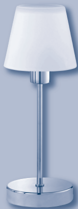
Tischleuchte mit Touchdimmer