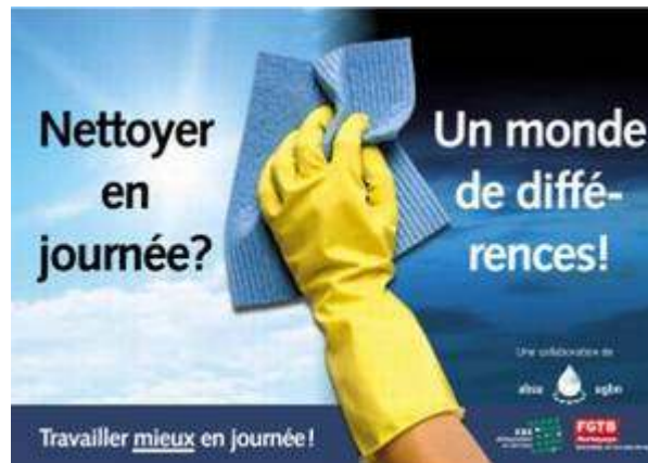
Abbildung 2: Sujet der belgischen Kampagne für die Tagesreinigung: „Tagsüber reinigen? Ein Unterschied ums Ganze!“

suspekt – spart körperliche Belastungen und Zeit ein. Außerdem ist in Nordeuropa, wo kurze Teilzeit qua Geschlechterregime weniger populär ist, die Reinigung tagsüber, während der Betriebs- und Bürozeiten üblich. Das ermöglicht zusammenhängende und ‚normalere‘ Arbeitszeiten, mehr direkte Kontakte und Koordination zwischen Putzkräften und EndkundInnen. In Belgien war dies auch Ziel einer Kampagne des sozialpartnerschaftlich geführten OpleidingsCentrum van de Schoonmaak – Centre de Formation du Nettoyage.