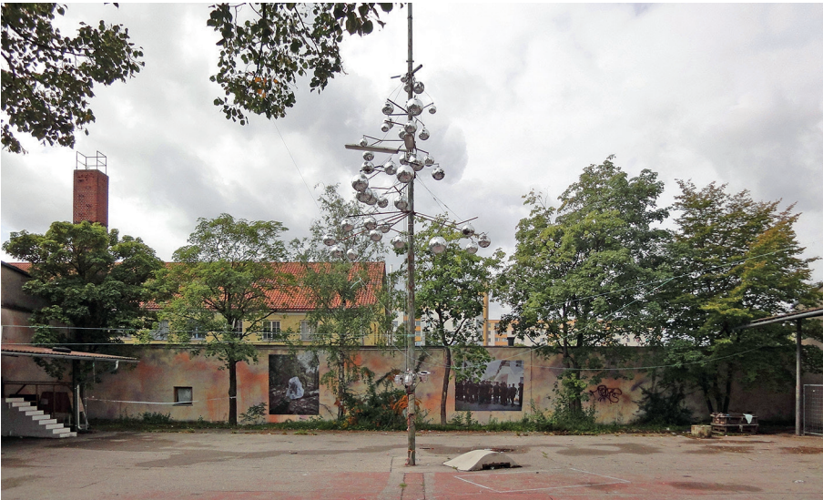
Abb. 1: Eindruck vom Münchner Labor (2017)

Nachdem 2007 die Realisierung des anspruchsvollen Entwurfs von Kazunari Sakamoto für die Neuplanung der Werkbundsiedlung abgelehnt wurde, sah die Stadt München 2011 die Chance, durch eine neue Wettbewerbsauslobung eine zusammenhängende Planung für das etwa 20 Hektar große Kreativquartier auszuschreiben. Denn das Besondere an diesem Areal war und ist die lebendige Kultur- und Kreativszene, die sich seit den 1990er Jahren im nordwestlichen Bereich niedergelassen hat. Ein Kreativquartier existierte also schon lange bevor der gleichnamige Wettbewerb ausgeschrieben wurde. Kreative Nutzungen sollten zwar erhalten, aber in den südlichen Teil umziehen, während im Großteil des Areals etwa 900 Wohnungen mit sozialer Infrastruktur, Büroflächen, Einzelhandel und Bildungseinrichtungen vorgesehen waren.