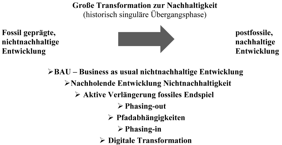
Abb. 4: Große Transformation zur Nachhaltigkeit – ausdifferenziertes Schema

Damit wurde schon die Vielzahl möglicher Wechselwirkungen der verschiedenen Entwicklungen und Einflussgrößen angedeutet.