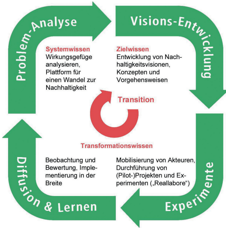
Abb. 2: Transition-Zyklus

Für die akademische Lehre/Bildung heben Wiek, Withycombe und Redman (2011) fünf Schlüsselkompetenzen hervor: die Kompetenz zum systemischen Denken, zum strategischen Denken und Handeln, zur interpersonellen Zusammenarbeit sowie die antizipatorische und die normative Kompetenz. In methodischer Hinsicht wird besonders das Lernen durch Ausprobieren und reflexives Lernen als bedeutsam erachtet (Michelsen/Adomßent 2014: 44 mit Verweis auf Martens 2006, Kemp/Martens 2007). Mit Blick auf eine transformative Wissenschaft weisen Schneidewind und Singer-Brodowski (2013) zudem darauf hin, dass es auch im universitären Bereich neben der Vermittlung von Systemwissen stärker um das Erlernen von Ziel- und Transformationswissen gehen sollte (mit Bezug auf die Bedeutung von Reallaboren z.B. Singer-Brodowski/Beecroft/Parodi 2018). Im Zusammenhang mit Zielwissen ist vor allem das Paradigma des Wirtschaftswachstums (SDG 8) diskussionswürdig, worauf kritische Ökonomen bereits seit Ende der 1960er / Anfang der 1970er Jahren hingewiesen haben (Boulding 1966; Daly 1996) und im Zuge des Nachhaltigkeitsleitbildes gegenwärtig um Ansätze zu „Postwachstum“ (Paech 2005; Seidl/Zahrnt 2010) und „Degrowth“ 7 erweitern. Noch heute, mehr als 40 Jahre nach den „Grenzen des Wachstums“