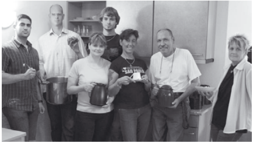
Im Dienst der Menschen | Das Team von der Suppenküche

Dass es arme Länder gibt, dass ihre Armut sich teilweise verschlimmert hat, spricht der Papst aus. Doch ist auch hier der Kontext bemerkenswert. Ganz dem »neoliberalen« Zeitgeist