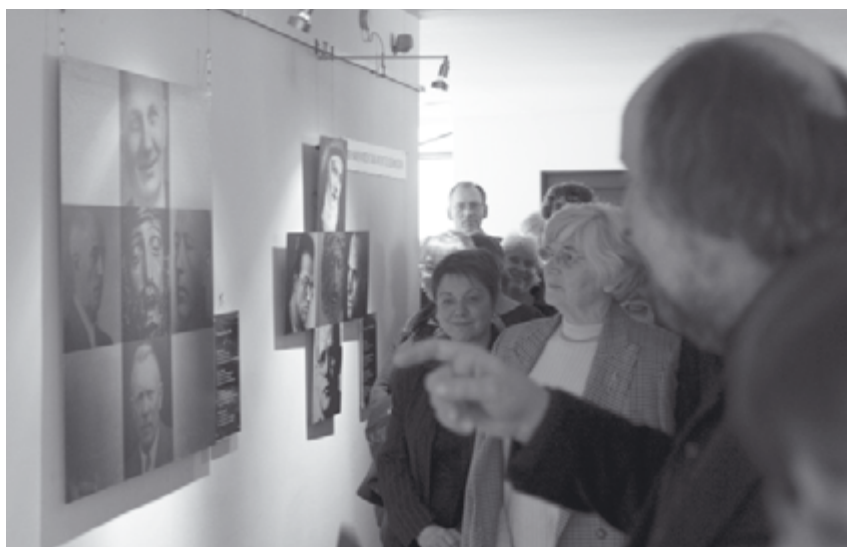
Kunstkreuze | Menschenkreuz

Das eine ist die Elternbildung, auf die in der religiösen Erwachsenenbildung ein verstärktes Augenmerk gelenkt werden sollte. Elternbildung wurde lange Zeit nicht als eigene Aufgabe der Erwachsenenbildung gesehen, sondern der Familienbildung jenseits der Erwachsenenbildung zugeordnet. Zukünftig müssen