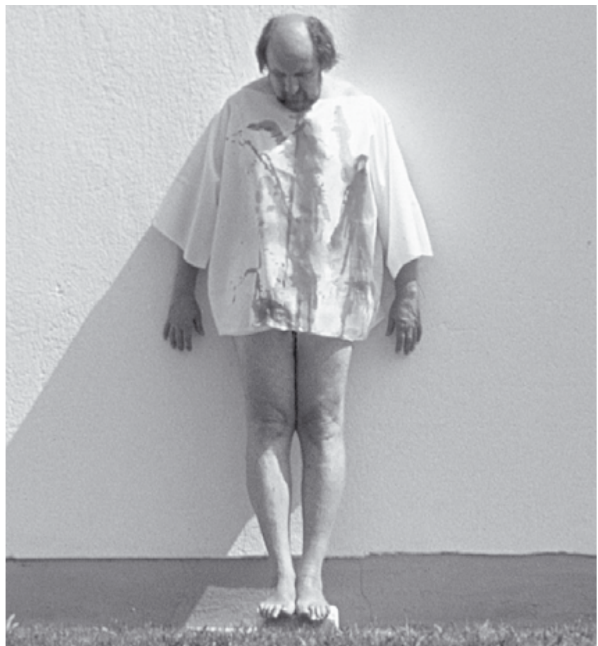
Kunstkreuze | Blutkreuz

Präsentationslogik. 9 Daran anknüpfend entwickelt Rolf Arnold das Konzept einer Ermöglichungsdidaktik für Bildungsprozesse, die das bisherige Konzept einer Erzeugungsdidaktik ablöst. 10 Eine konstruktivistische Pädagogik verweist dabei auf die Zufälligkeit pädagogischer Wirksamkeit sowie auf die notwendige begriffliche Konstruktionsleistung des Subjektes im Lernprozess. Statt um Vermittlung oder Lehre geht es um Anregung und Ermöglichung. Der systemische Bildungsbegriff, der für die Erwachsenenbildung und insbesondere die religiöse Bildung erst allmählich an Bedeutung gewinnt 11 , ist sehr stark subjektorientiert. Das mündige Subjekt, das nicht belehrt, sondern in seinem eigenen Lernen unterstützt und begleitet wird, steht im Mittelpunkt und wird in seinen selbsttätigen und selbstbildenden Konstruktionsprozessen, die nicht steuerbar oder vorhersagbar sind, ernst genommen. Religiöse Bildungsangebote in der kirchlichen Erwachsenenbil-