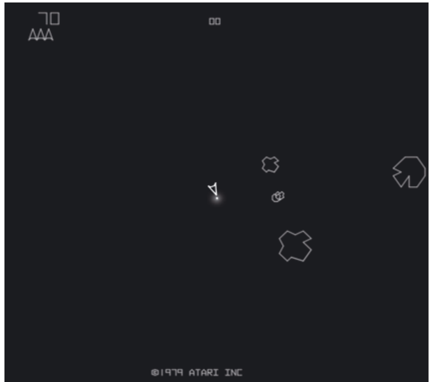
Daddeln wie in alten Zeiten | Asteroids (1979)

In seiner Botschaft zum »Welttag der sozialen Kommunikationsmittel« im Jahr 2009 hat Papst Benedikt XVI. die Bedeutung der sozialen Kommunikationsnetze herausgehoben. Er schrieb: »Diese Technologien sind ein wahres Geschenk für die Menschheit: Wir müssen daher sicherstellen, dass die Vorteile, die sie bieten, allen Menschen und Gruppen zugute kommen, vor allem den Bedürftigen und Schwachen.« 10 Der Papst spricht damit bedeutende Aspekte an: Gerechtigkeit im Blick auf die Zugänge zu den Mitteln der sozialen Kommunikation und darüber hinaus gerechte Möglichkeit der Partizipation am gesellschaftlichen und kulturellen Leben. Gerade weil