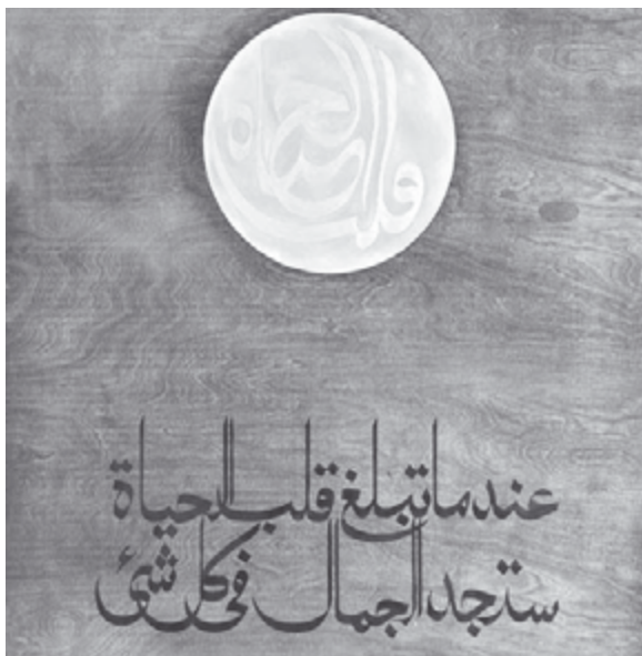
Gottespoesie | »Herz des Lebens / Wenn Du das Herz des Lebens erreichst, findest Du die Schönheit in allen Dingen«. Gedicht vom Khalil Gibran.