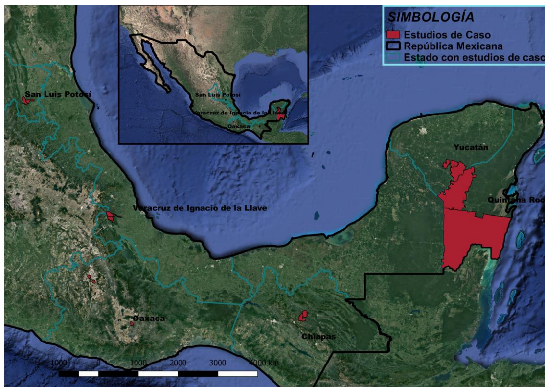
Imagen 1: Mapa de localización