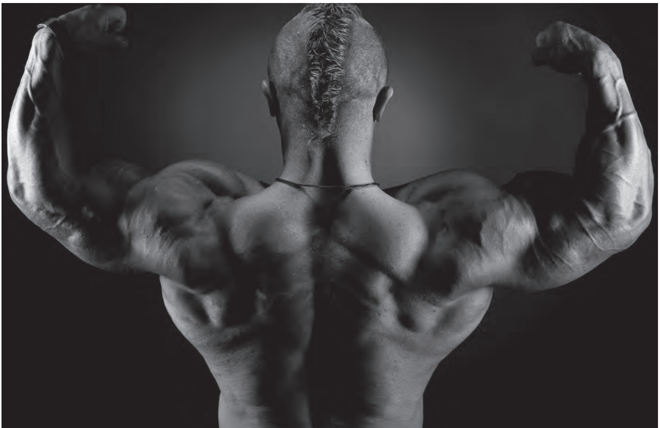
Kraft-Akt | Hauteng

Sehnsüchte allein machen aber noch keinen Sinn, obwohl es gerade beim Sehsinn so erscheint. Sie bekommen