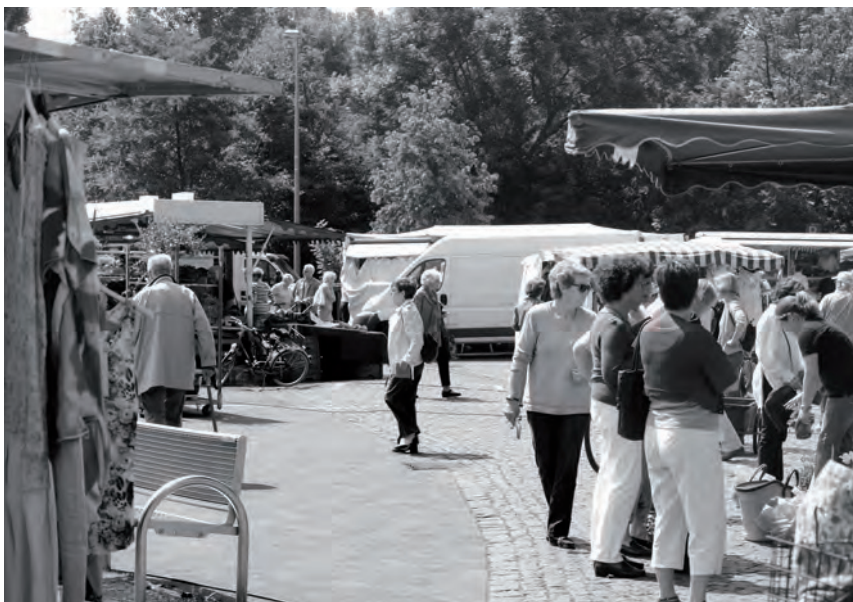
Lebensglück: Sozialer Frieden