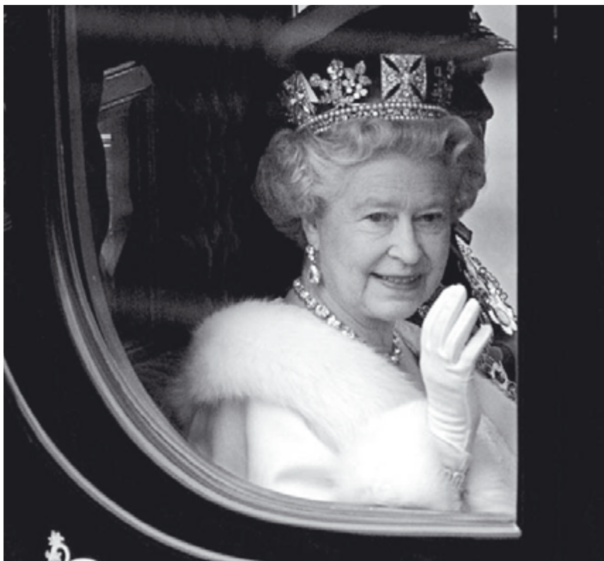
Führungskräfte | Queen Elisabeth II