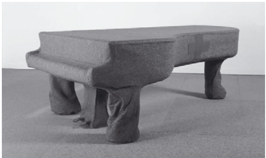
Joseph Beuys: Infiltration homogen für Konzertflügel, 1966 und La peau, 1984, Konzertflügel, Filz, Stoff