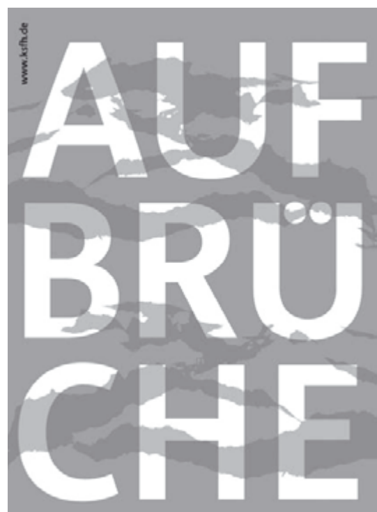
Titel des Werbeflyers