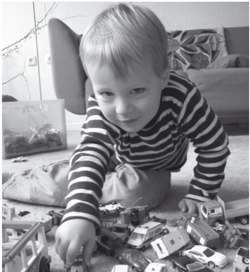
Kinder einer Straße | Moritz

werden konkrete Erziehungsfragen, Jugendliche und Pubertät, Ausbildung/berufliche Zukunft besonders häufig genannt. Dass die Mehrzahl der Eltern wenig Vertrauen in das öffentliche Bildungssystem hat, zeigt die Studie »Eltern unter Druck« 12 . Kritikpunkte sind schlechte Ausstattung der Schulen, zu große Klassen, Überforderung der als wenig engagiert und häufig als schlecht ausgebildet erlebten Fachkräfte bis hin zu starren Strukturen und wenig innovativen Konzepten. Eltern gehobener Milieus bis in die bürgerliche Mitte hinein nehmen deshalb die Förderung ihrer Kinder zu einem möglichst frühen Zeitpunkt selbst in die Hand. Die Zauberformel »frühe Förderung« wird zum Rettungsanker. Auch die Eltern mit Kindern im Kindergartenalter sind verunsichert und unter allgegenwärtigem Druck, nur keine Chance auszulassen: »Selbst sie