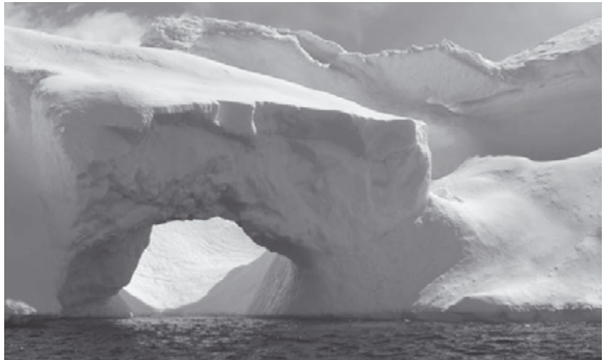
Paradies aus Eis

Um zum Handeln zu kommen, ist die konkrete Betroffenheit des Einzelnen 15 , die Verantwortung für unsere Gesellschaft, für die globale Situation und insbesondere für die Gesell-