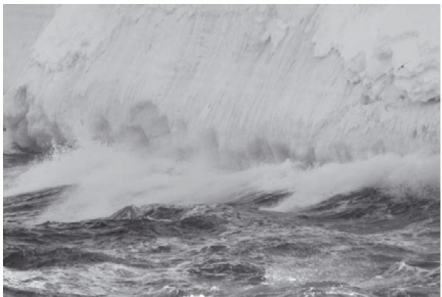
Paradies aus Eis

Konsequenzen einer derartigen Erwärmung überfordert. Bis zu 1/5 der Weltbevölkerung wäre durch häufigere Überschwemmungen gefährdet. Bis zu 3,2 Milliarden Menschen wären von steigender Wasserknappheit betroffen. Bis zu 120 Millionen Menschen zusätzlich wären vom Hunger bedroht. Es droht ein weltweites Artensterben – vor allem in Feuchtgebieten, Wäldern und Korallenriffen, etwa 30 Prozent der küstennahen Feuchtgebiete könnten absterben. 7 Der IPCC, der einen Konsens zwischen weltweit mehr als 1000 Wissenschaftlern und der Politik darstellt, projiziert mit seinen eher zurückhaltenden Aussagen eine mittlere globale bodennahe Erwärmung bis 2100 von 1,1° bis 6,4° C. 8 In den letzten drei Jahren lagen die globalen Emissionen jedoch über den pessimistischsten Annahmen des IPCC. Das bedeutet, dass der Temperaturtrend derzeit über der Kurve des IPCC liegt, die auf 6,4° C zuläuft. »Fünf bis sechs Grad (wärmer), das gibt einen anderen Planeten, auf dem es nicht möglich sein wird, eine Hochkultur, wie wir sie kennen, aufrechtzuerhalten. Dafür lege ich meine Hand ins Feuer«, sagte dazu Prof. Dr. Hans Joachim Schellnhuber bei der Verleihung des Deutschen Umweltpreises in Aachen im Oktober 2007.