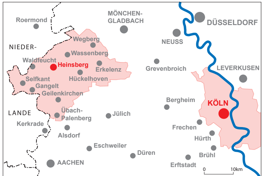
Abbildung 1: Die Untersuchungsräume

Zur Erfassung der Perspektive der lokalen Akteure führten wir zwischen Oktober 2016 und Juni 2017 insgesamt 29 Experteninterviews mit Vertreter_innen der Kommunen und des Kreises, der Stadtgesellschaften sowie der Landesebene. Die Interviewpartner_innen wählten wir aufgrund ihrer beruflichen/ehrenamtlichen Tätigkeit und Zuständigkeit im Integrationsprozess von Geflüchteten. Zudem führten wir zwischen März und November 2017 insgesamt 41 Interviews mit Geflüchteten. Bei der Auswahl dieser Gruppe von Interviewpartner_innen verfolgten wir das Ziel, möglichst unterschiedliche Lebenssituationen zu berücksichtigen, die einen Einfluss auf den Integrationsprozess haben könnten (z. B. Alter, Geschlecht, Herkunftsland, Familiensituation, Bildung). Der Kontakt zu den Interviewpartner_innen wurde von Mitarbeiter_innen in kommunalen Verwaltungen, Beratungseinrichtungen und Bürgerinitiativen hergestellt, die beruflich oder ehrenamtlich mit Geflüchteten arbeiten. Ein solcher Zugang sollte helfen, eine vertrauensvolle Interviewatmosphäre herzustellen. Die Vermittlung von Interviewpartner_innen durch vertraute und vertrauensvolle Gatekeeper wurde auch von Kutscher und Kreß (2018) angewandt und als wichtiger forschungsethischer Aspekt bezeichnet. Die Interviews wurden zumeist in den Büros der Einrichtungen geführt. Die durch Leitfäden gestützten Interviews thematisierten die Erfahrung der Geflüchteten bei Ankunft am derzeitigen