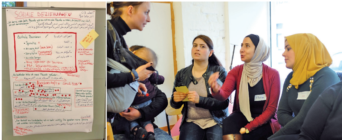
Abbildung 3: Workshop mit Geflüchteten im November 2017 im Allerweltshaus in Köln