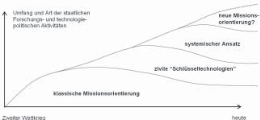
Abbildung 1: Trends der Schwerpunktsetzung in der Forschungs- und Technologiepolitik: Schematische Darstellung

Die Entwicklung der vergangenen 50 Jahre ist dadurch charakterisiert, dass einmal gewählte Ausformungen von Schwerpunktsetzungen nicht durch andere abgelöst wurden, sondern neue inhaltliche Schwerpunkte, institutionelle Arrangements und Begründungszusammenhänge auf den zuvor etablierten Strukturen additiv aufsetzten. Diese Entwicklung wurde als ein „Schalenmodell“ der historischen Entwicklung bezeichnet (vgl. Fier 2002) und dient auch als Grundlage für die folgende Diskussion. Dabei unterscheiden wir vier Trends, die in Bezug auf ihre Entstehungsgeschichte eine gewisse zeitliche Abfolge aufweisen, die aber alle bis heute in unterschiedlicher Bedeutung und Gewichtung fortwirken (vgl. Abbildung 1): Die „klassische“ Missionsorientierung, die in den 1940er und 1950er Jahren einsetzte, die Ausweitung der Technologieförderung auf zivile „Schlüsseltechnologien“ ab den 1960er Jahren, die Ergänzung der thematischen Förderung um generische